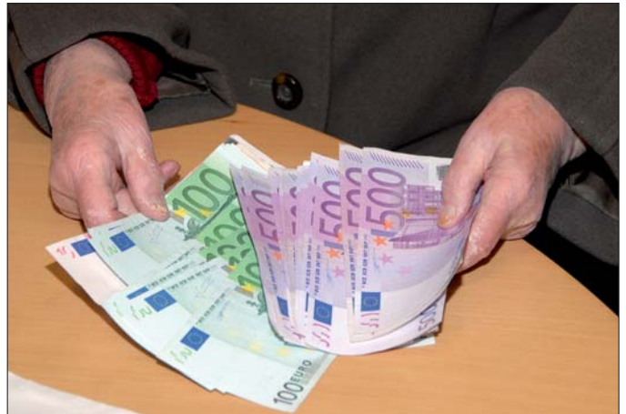
Bankgeschäfte: Die Polizei rät, sich höhere Geldbeträge in einem separaten Raum in der Bank auszahlen zu lassen.

der Regel begibt sich einer der Täter in das Geldinstitut und stellt sich an einem Kassenschalter an oder er setzt sich an einem Platz nieder, von wo er den Kassenschalter beobachten kann. Die Täter wechseln Geld, ersuchen Bankangestellte um eine Auskunft oder tun so, als ob sie bei einem Bankomaten Geld beheben. Einer der Komplizen verlässt die Bank kurz vor dem Opfer, um die vor der Bank wartenden Mittäter zu informieren.