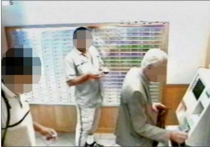
Bankanschlussdelikt: Täter beobachten ihr Opfer in einer Bank bei den Geldgeschäften, verfolgen und überfallen es.