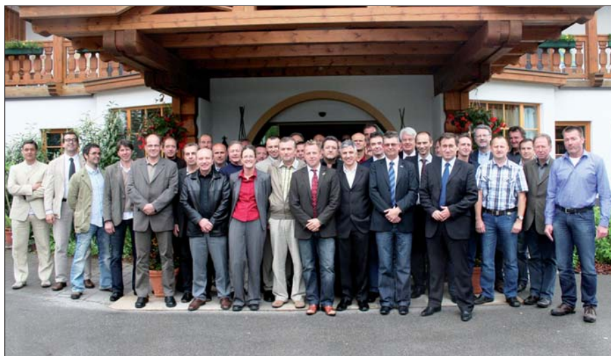
Teilnehmerinnen und Teilnehmer der Tagung in Windischgarsten zur Bekämpfung der internationalen Raubkriminalität.