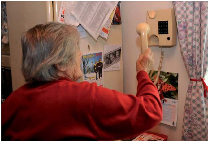
Neffentrick: Die Täter setzen die Opfer, vorwiegend ältere Frauen, telefonisch unter Druck, damit sie Geld beheben.