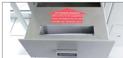
Schlüsseltresor einer Autofirma: Vor-sicht beim Deponieren des Schlüssels.

Kennzeichen, Änderung der FIN). Die Polizei konnte einige in Österreich durch „Schlüsselfischen“ gestohlene Autos sicherstellen. Ein VW Golf mit deutschem Kennzeichen, der durch „Schlüsselfischen“ im September 2009 in Salzburg bei der Firma Porsche gestohlen worden war, tauchte in einer VW-Werkstätte in Polen auf. Da das Auto in Deutschland angemeldet war, schrieb die dort zuständige Behörde das Fahrzeug zur Fahndung aus. Der deutschen Polizei ist es erlaubt, Fahndungsdaten den Fahrzeugherstellern zu übermitteln, was in Österreich aufgrund des Datenschutzes verboten ist. Somit weiß der Hersteller, dass ein bestimmtes Fahrzeug mit einer bestimmten Fahrzeugidentifikationsnummer als gestohlen gilt. Falls der oder die Täter