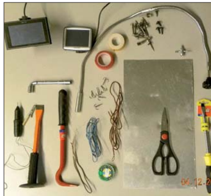
Schlüsselfischen: von der Polizei sichergestelltes Tatwerkzeug.

Organisierte Banden. Bei den „Schlüsselfischern“ handelt es sich laut Ermittlungen der Polizei um organisierte polnische und ukrainische Banden. Die Verdächtigen stahlen zwischen September 2009 und Mai 2010 22 Autos in Österreich. Meist schlagen die Täter in der Nacht von Sonntag auf Montag zu. Bevor sie die gestohlenen Autos ins Ausland bringen, werden diese meist „zwischengelagert“ und technisch verändert (Austausch der