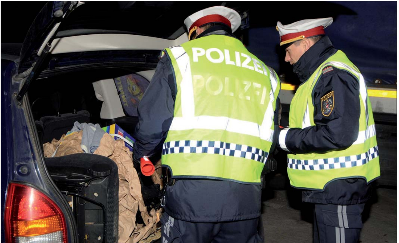
Schwerpunktaktionen der Polizei: Zentrales Element des Masterplans gegen Einbruchskriminalität.