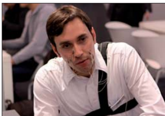
Elektromyographie: Spracherkennung ohne Laute.