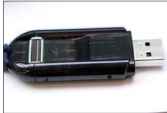
USB-Stick: Erst durch Fingerabdruck verwendbar.

Als „so einfach wie E-Mail, so sicher wie Papierpost“ wird De-Mail für die schriftliche elektronische Kommunikation angekündigt ( www.de-mail.de ), vergleichbar etwa mit einem verschlossenen Brief. Die übliche E-Mail ist mit einer Postkarte zu vergleichen. Zusätzlich können Versand- und Zustellnachweise erstellt werden („Einschreiben“). Bei diesem Kommunikationssystem, zu dem man sich bei der Anmeldung zuverlässig identifizieren muss, sind Versender und Empfänger eindeutig nachvollziehbar. Das hilft, Phishing und Spamming zu vermeiden. Eine Installation von Hard-