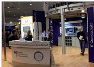
Stand des BSI auf der CeBIT 2010.

oder Software ist nicht erforderlich. Die Nachricht wird im Internet verschlüsselt übertragen und kann nicht mitgelesen oder verändert werden. Die Ergebnisse der derzeit laufenden Erprobung werden als „Technische Richtlinien“ in die weitere Entwicklung einfließen.