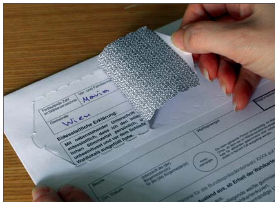
Bei der Bezirkswahlbehörde wird die Lasche zur Datenerfassung geöffnet, ohne dass das Wahlkuvert aufgerissen wird. Das ist erst bei Anwesenheit der Mitglieder der Wahlkommission zulässig.

men“ oder (bei eingetragenen Partnerschaften) einen „Nachnamen“ einzutragen; sämtliche Formulare wurden dementsprechend angepasst.