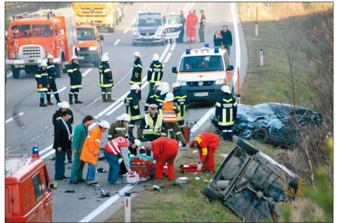
Immer wiederkehrende Bilder nach Belastungen: Einsätze bei Verkehrsunfällen mit Toten und Schwerverletzten.

von ihren Trainern eingeschätzt. In der Selbsteinschätzung hatten die Teilnehmer das Gefühl, kritische Situationen besser bewältigen zu können. Das deckte sich mit der Fremdeinschätzung. Die trainierten Beamten empfanden sich belastbarer. Die Trainer orteten bei den Betroffenen weniger Stress und geringere Nervosität.