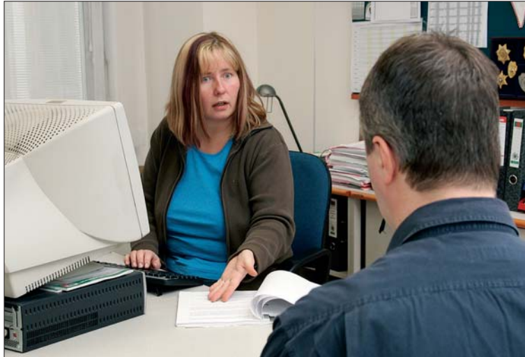
Polizeiliche Vernehmung: „Der Versuch, mehr oder weniger wahre Erinnerungen beim Gegenüber wachzurufen.“

„Die junge Frau erzählte die Geschichte den Polizisten derart neutral