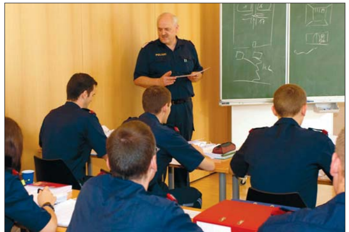
Einsatztraining der Bundespolizei: Die Einsatzkompetenz von Polizisten lässt sich durch gezieltes Training deutlich verbessern.