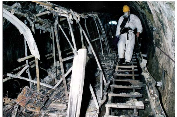
Belastend für Einsatzkräfte: Katastrophen wie der Tsunami in Südostasien oder das Seilbahnunglück in Kaprun.