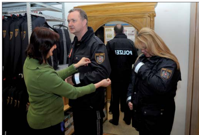
Bekleidungswirtschaftsfonds: Polizistinnen und Polizisten können die Uniform vor der Bestellung anprobieren.