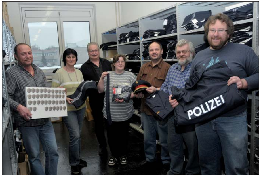
Bekleidungswirtschaftsfonds: Etwa 120 verschiedene Uniformartikel in mehr als 1.600 verfügbaren Größen werden in 14 Lagerräumen gelagert.

Die Verteilung der Uniformartikel für die 27.000 Polizistinnen und Polizisten erfolgt über ein zentrales Lager. Etwa 120 verschiedene Uniformartikel in mehr als 1.600 verfügbaren Größen werden in 14 Lagerräumen gelagert. Die per Intranet einlangenden Anforderungen werden im Ausgabelager zusammengestellt und nach einer End-