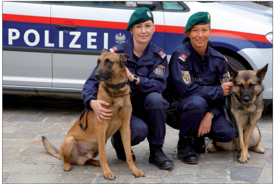
„Kommissar Rex“: Bei der Bundespolizei sind 408 Diensthunde in ganz Österreich eingesetzt.

Einsatztraining. Für die Organisation und Koordination des Einsatztrainings ist das Einsatz-Referat verantwortlich. Es gibt vier Bundeseinsatztrainer, neun Landeseinsatztrainer und rund 450 nebenamtliche Einsatztrainer in den Organisationseinheiten des Innenministeriums. Die Einsatztrainer absolvieren eine siebenwöchige Ausbildung, darunter Schießausbildung, Einsatztaktik, Einsatztechniken, interaktives Szenarietraining (Rollenspiele). Sie bilden die rund 25.000 Polizisten aus. Pro Beamten sind 20 Stunden Einsatztraining pro Jahr vorgesehen. Dazu werden Jahresausbildungsschwerpunkte im Einsatztraining erarbeitet. „Im Einsatztraining werden Situationen möglichst praxisnah geübt“, sagt Referent Oberst Hermann Zwan-