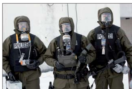
Gefahrstoffkundige Organe: Sofortabklärung bei ABC-Verdachtsfällen.

Gefahrstoffkundige Organe. Das Innenministerium verfügt seit November 2005 über „Gefahrstoffkundige Organe“ (GKO). 26 Polizei-Strahlenspürer wurden in einem vierwöchigen Lehrgang in der Zivilschutzschule der Sicherheitsakademie des Innenministeriums zu ABC-Experten ausgebildet – in den Fächern Biologie, Chemie, Notfallmedizin, Einsatztaktik, Tatortarbeit, Sprengstofftechnik und Messtechnik. Die Gefahrstoffspezialisten arbeiten eng zusammen mit den „Sprengstoff-