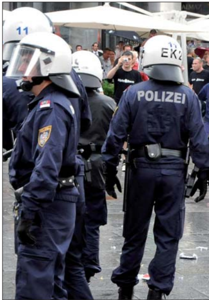
Großveranstaltungen erfordern den Einsatz geschlossener Polizeieinheiten.

kundigen Organen“ (SKO) und den Strahlenspürern des Innenministeriums. Die GKO gehören organisatorisch den Landespolizeikommanden an. Bei Einsätzen unterstehen sie dem Einsatzreferat in fachlicher Hinsicht.