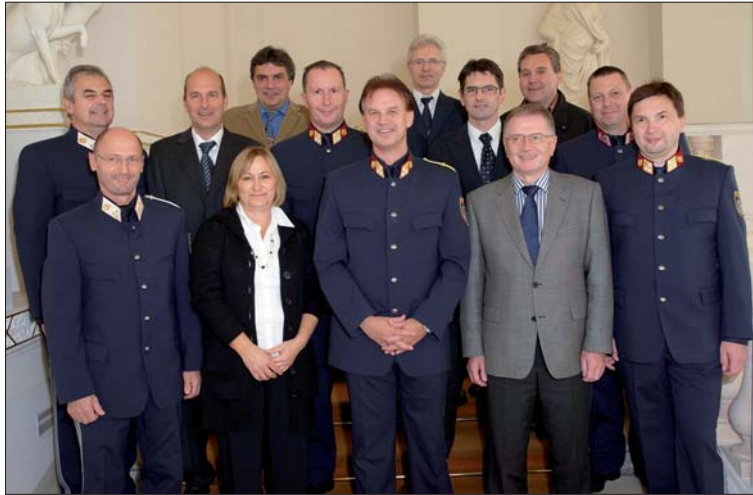
Mitarbeiterinnen und Mitarbeiter des Einsatzreferats im BMI.

Für ordnungsdienstliche Einsätze der Polizei in den Ländern gibt es eigene Einsatzeinheiten (EE), deren Angehörige für den GSOD ausgebildet sind. Die Einsatzeinheit wird einberufen, wenn das Einschreiten von geschlossenen Einheiten der Bundespoli-