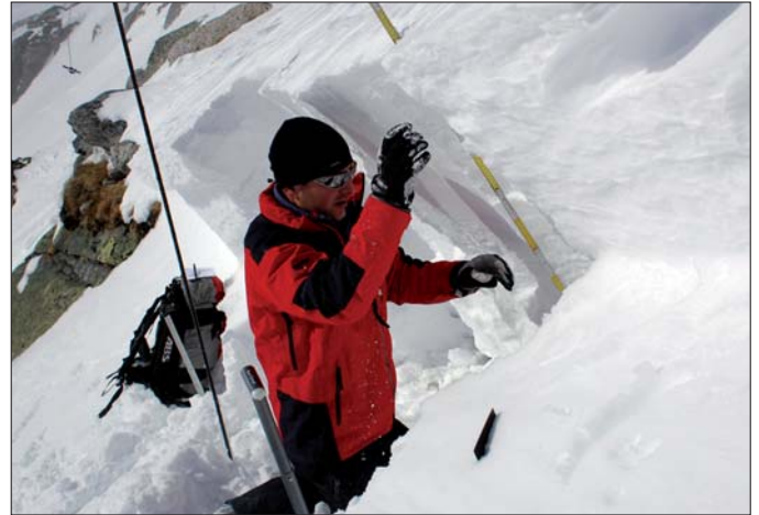
Alpinpolizei: Zu den Hauptaufgaben zählen die Erhebung und Klärung von Alpinunfällen.

ferat angegliedert. Die Polizei hat 408 Diensthunde in ganz Österreich, die alle zu Schutz- und Stöberhunden ausgebildet sind. Unter ihnen gibt es Spezialisten: 105 Suchtmittelspürhunde, 36 Sprengstoffspürhunde, 28 Brandmittelspürhunde, 17 Leichen- und Blutspurenspürhunde, 16 Lawinenverschüttetenspürhunde, 15 Fährtenpürhunde, 8 Verschüttetenspürhunde und 5 Bargeld- und Dokumentenspürhunde. Die Diensthundeführer hatten 2008 166.000 Einsätze zu bewältigen. Etwa ein Drittel davon waren Objekt- und Personenschutz-Einsätze, der Rest verteilt sich auf die Suche nach abgängigen und verschütteten Personen, Leichen, Gegenständen, Sucht- und Brandmitteln, Sprengstoffen und sonstige Einsätze.