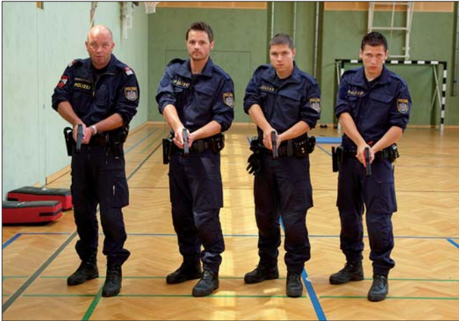
Schießausbildung: Die Handhabung der Dienstwaffen soll verbessert werden.