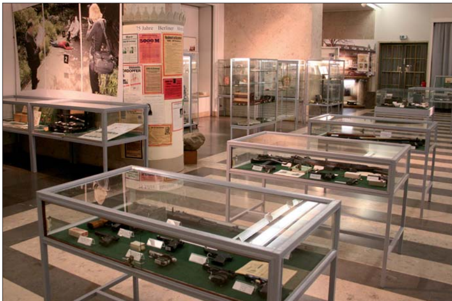
Die polizeihistorische Sammlung im Präsidium der Berliner Polizei ist eine der größten dieser Art in Europa.

trats war unter anderem zuständig für die Dienstaufsicht über die Polizisten, weiters über die Aufsicht der Schlächter, Wirtshäuser und Bettler sowie für die Überwachung der Einhaltung der Gesindeordnung.