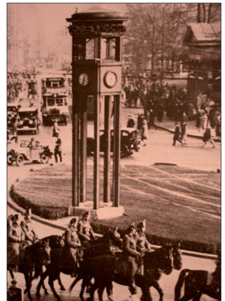
Der legendäre „Verkehrsturm“ auf dem Potsdamer Platz.

In dieser Zeit trieb auch ein Serienmörder in Berlin sein Unwesen: Am 21. August 1921 wurde in Berlin Carl Friedrich Wilhelm Großmann verhaftet, neben seinem letzten Opfer. Bei der Durchsuchung der Wohnung in der Lange Straße fanden die Kriminalisten Frauenkleider und im Herd Leichenteile. Drei Morde konnten Großmann zweifelsfrei zugeordnet werden, die Zahl seiner Opfer wird aber auf mindestens 20 geschätzt. Der Sohn eines Lumpensammlers in Neuruppin arbeitete als Fleischer und Hausierer und war mehrmals im Gefängnis. Später betrieb er am Schlesischen Bahnhof in Berlin einen Würstelstand, wo er vermutlich seine Opfer ansprach und zu sich in seine Wohnung einlud. Es handelte sich großteils um Prostituierte und allein stehende Frauen. Zwischen 1918 und 1921 wurden in den Gewäs-