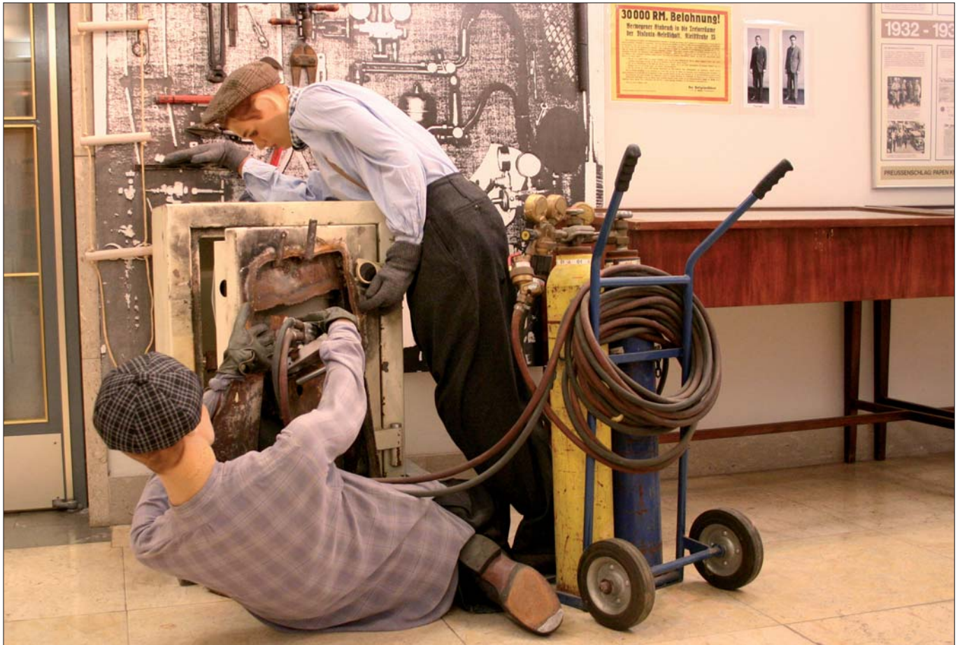
Darstellung der legendären Berliner „Panzerknacker“ Franz und Erich Sass: Schneidbrenner als neues Einbruchswerkzeug.