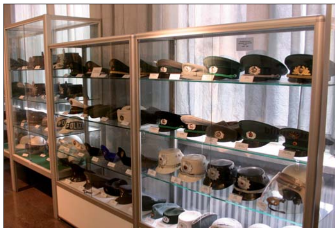
Sammlung von Uniformkappen aus dem In- und Ausland.

tion von Sinti und Roma verantwortlich war. Gleichzeitig unterhielt er Kontakte zum deutschen Widerstand. Nach dem Attentat auf Adolf Hitler vom 20. Juli 1944 wurde Nebe vom Volksgerichtshof zum Tode verurteilt und hingerichtet. 1938 gab es die erste Fernsehfangung: Die Berliner Kriminalpolizei konnte nach einem Aufruf einen Mörder festnehmen.