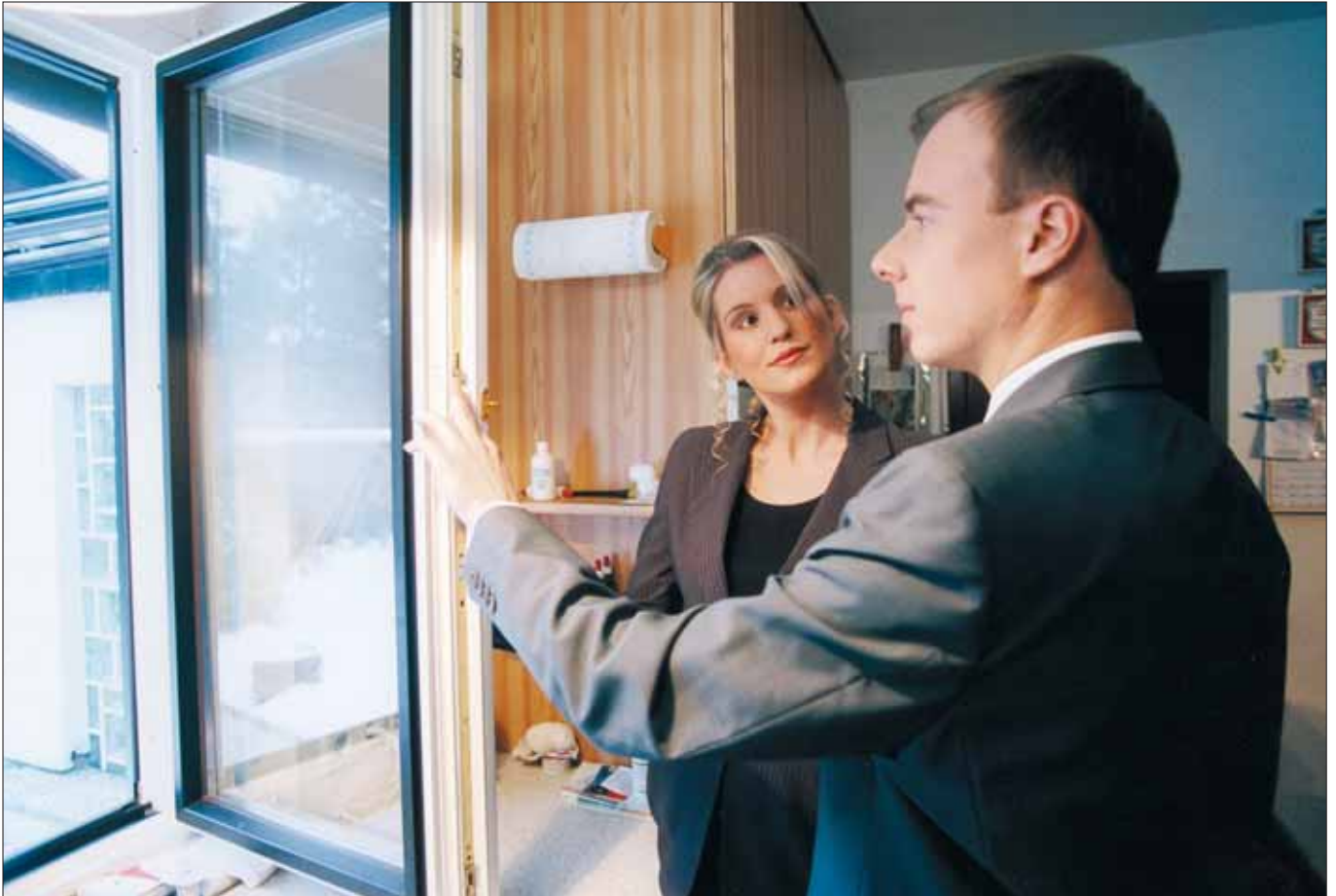
Häufiger Schwachpunkt Fenster: Ein Rundum-Schutz ist wichtig, um Einbrecher abzuhalten.