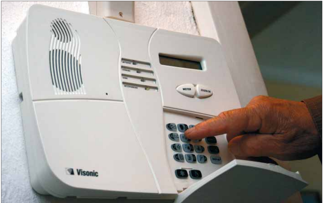
Alarmanlage: Die Meldezentrale im Haus sollte einfach bedient werden können.

wa ein Einbrecher dazwischentritt, schlägt die Auswerteelektronik Alarm. Registriert wird, dass die Reflexionszeit des Ultraschalls kürzer ist, da ja der Abstand zwischen dem Sender und der Wand größer ist als zwischen dem Sender und dem durchmarschierenden Einbrecher. Dieses System eignet sich für Räume in einer Größe bis zu etwa 40 Quadratmetern.