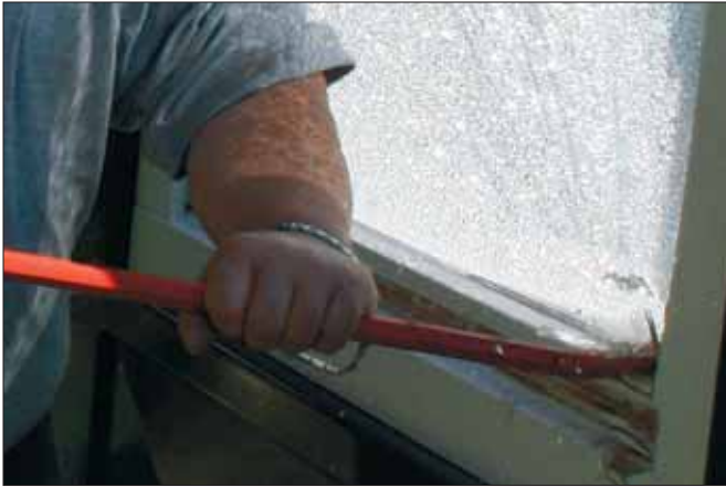
Einbrecher haben viel zu oft leichtes Spiel: Wenn ein Schraubenzieher nicht ausreicht, gehen sie zum „Geißfuß“ über.

mechanischen Mindestgrundschutz. Dazu gehört eine Sicherheitstür, versperrbare Fenster- und Terrassentürenriegel, eine Mehrfachverriegelung an allen Fenstern und Terrassentüren sowie eine Einstiegsabsi-