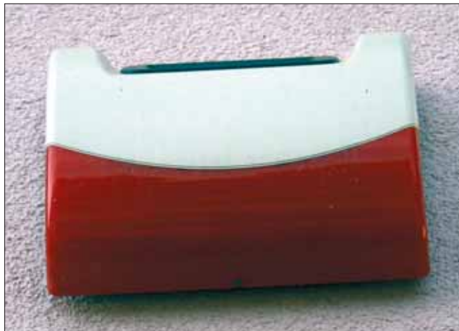
Acht Prozent der österreichischen Haushalte besitzen eine Alarmanlage. Sie wird als gute Maßnahme betrachtet.

Im März 2009 erhub das Market-Institut das Sicherheitsgefühl der Österreicher. Drei Viertel der Bevölkerung machen sich „große Sorgen“ um Geld und Wertsachen. Ebenso viele fürchten „Unbehagen“ in den eigenen vier Wänden in Folge eines Einbruchs. Den Österreichern liegt viel an Gegenständen mit hohem persönlichen, aber geringem materiellem Wert: Sieben von zehn Österreichern sorgt der Verlust solcher Gegenstände. Rund acht Prozent der öster-