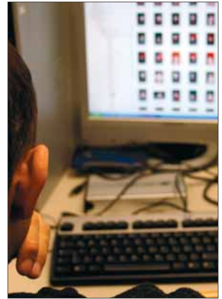
Die Beamten müssen Bild für Bild nach Verbotenem absuchen.

In der Operation „Sledgehammer“ im Vorjahr beispielsweise waren die Wiener Kriminalbeamten bei 66 der 94 Hausdurchsuchungen auf Anhieb erfolgreich. Der internationale Schlag gegen Kinderpornografie ging von Kroatien aus. Dort hatten Kinderpornohändler eine Astrologie-Website geknackt und sie als Mega-Tauschbörse besetzt. Die Polizei war dahinter gekommen, überwachte die Homepage mehrere Tage