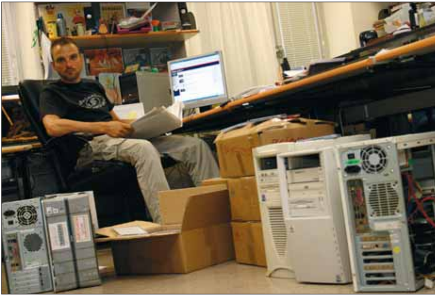
Die Kinderpornobekämpfer beschlagnahmen immer mehr Festplatten mit immer größeren Datenmengen – mittlerweile im Bereich von Terabytes.

verzerrt, auf sich selbst reduziert“ abgebildet sind und der „sexuellen Erregung des Betrachters dienen“, etwa die Genitalien eines Kindes oder Jugendlichen in Großaufnahme. Auch harmlose Fotos, zum Beispiel von Kindern beim Eisschlecken, gelten als Kinderpornografie, wenn die Bilder nachträglich am Computer zur Pornografie nachbearbeitet werden – allerdings nur, wenn die Darstellung an andere weitergegeben wird. Zum „eigenen Gebrauch“ dürfen Kinderbilder jedoch in dieser Weise verändert werden.