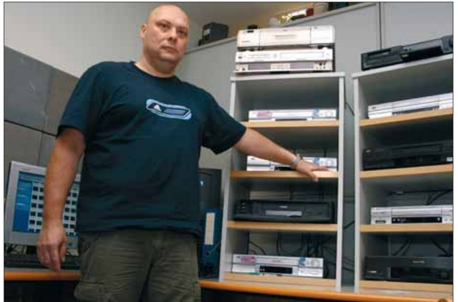
Media-Auswertesystem: Videorekorder scannen Datenträger und speichern Bilder sequenzweise. Die Beamten müssen sich nicht die ganzen Filme ansehen.

Vorwiegend in Osteuropa hat das neue Märkte generiert, wo Kinder zum Beispiel in aufreizenden Posen um