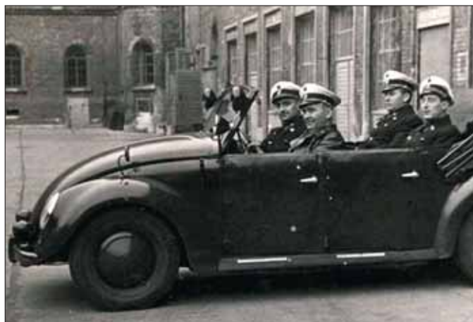
„Vier im VUK“: 1952 wurde das VUK gegründet – damals rückten vier Beamte zu Unfällen aus. Heute sind es zwei.