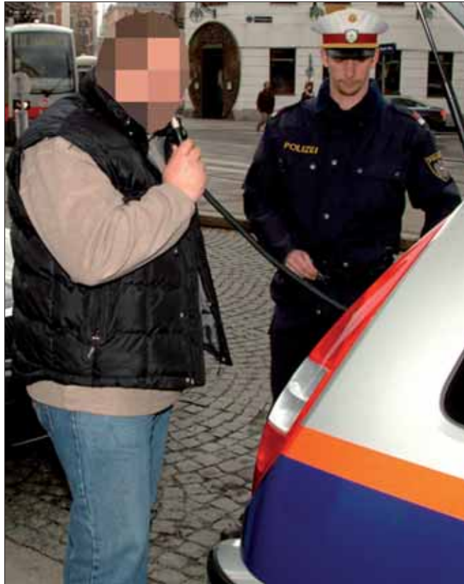
Der Aufforderung eines Polizisten zum Alkotest ist auch Folge zu leisten, wenn das Fahrzeug nicht selbst gelenkt wurde.

Dass nicht er, sondern ein näher genannter Zeuge sein Kraftfahrzeug gelenkt habe, spiele keine Rolle. Aufgrund der wahrgenommenen Alkoholisierungsmerkmale habe der begründete Verdacht des Lenkens in alkoholisiertem Zustand bestanden, zumal die einschreitenden Beamten bei einer Überprüfung des Fahrzeuges feststellen konnten, dass die Motorhaube noch warm war. „Für die Beamten war daher auch keine Verpflichtung gegeben, den Beschwerdeführer darüber zu befragen, wer das Fahrzeug gelenkt habe“, be-