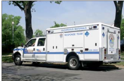
„Haz-Mat-Truck“ der Capitol Police: Aufspüren von Sprengstoffen und anderen gefährlichen Substanzen.