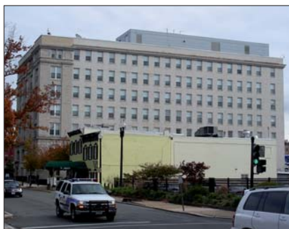
Hauptquartier der U.S. Capitol Police in Washington.

Bereits 1801, ein Jahr nach dem Bezug des (noch unfertigen) Kapitols, wurde mit John Golding der erste Wachmann des Parlaments eingesetzt. Dieser hatte keine Polizeigewalt und musste sich im Ernstfall der Hilfe der Marines bedienen. 1824 wurde über die Gründung einer Sicherheitstruppe auf parlamentarischem Boden nachgedacht; 1828 wurde von Präsident John Quincy Adams die U.S. Capitol Police eingerichtet, nachdem sein Sohn in der Kuppelrotunde angegriffen worden war. Die vier Kapitolspolizisten trugen zu Beginn keine Uniform und waren bei größeren Menschenmassen auf Unterstützung der Auxiliary Guard von Washington, D.C. angewiesen. Zu Be-