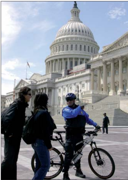
Fahrradpolizist beim Kapitol.

ton folgt eine achtwöchige Grundausbildung im Federal Law Enforcement Training Center (FLETC) in Glynco, Georgia oder in Artesia, New Mexico, an die sich eine zehnwöchige Schulung in der Capitol Police Training Academy anschließt. Auf die theoretische Phase folgt die Praxisphase unter der Anleitung eines Field Training Officer . In den letzten zehn Jahren, besonders seit 9/11, hat sich das Personal der Capitol Police deutlich erhöht. Waren Ende 2001 noch knapp 1.200 uniformierte Polizisten im Stand, waren es im Jahr 2008 beinahe 1.700. Dazu kommt eine hohe Zahl ziviler und administrativer Kräfte, die zu einer Gesamtsumme von circa 3.000 Bediensteten führt.