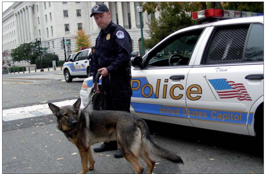
Diensthundeführer der Capitol Police mit Sprengstoffspürhund.

Der Luftraum über Washington wird in Zusammenarbeit mit der Federal