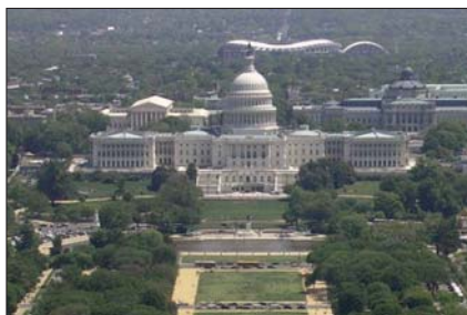
Das Kapitol in Washington: Die erste Parlamentssitzung fand 1800 statt.

Den Grundstein des Kongressgebäudes, das „Capitol“ genannt wurde, legte der erste Präsident der USA, George Washington, am 18. September