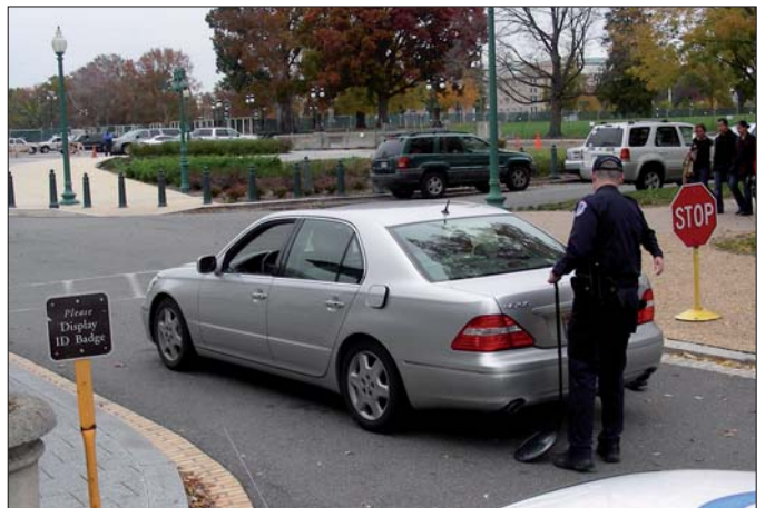
Strenge Sicherheitsvorkehrungen der U.S. Capitol Police: Checkpoint beim Senat; genaue Kontrolle eines Pkws.

zusammengearbeitet wird, ist das Kapitol mit seinen verschiedenen Gebäuden und unterirdischen Gangsystemen, durch die teilweise eine eigene Parlaments-U-Bahn läuft, eine Stadt in der Stadt. Einschlägige Orts- und Personenkenntnisse sind ebenso erforderlich, wie eine schnelle Reaktionsmöglichkeit im Ernstfall.