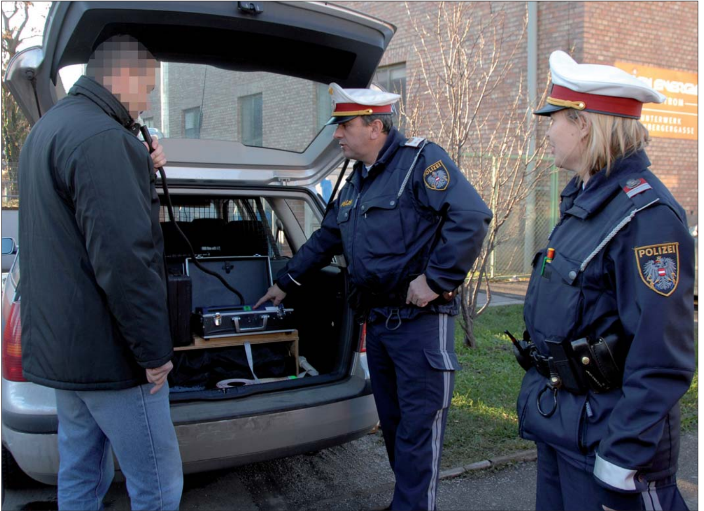
Alkotest: Auch ein alkoholisierte Fußgänger, der einen Verkehrsunfall verursacht hat, muss sich einem Alkotest unterziehen.