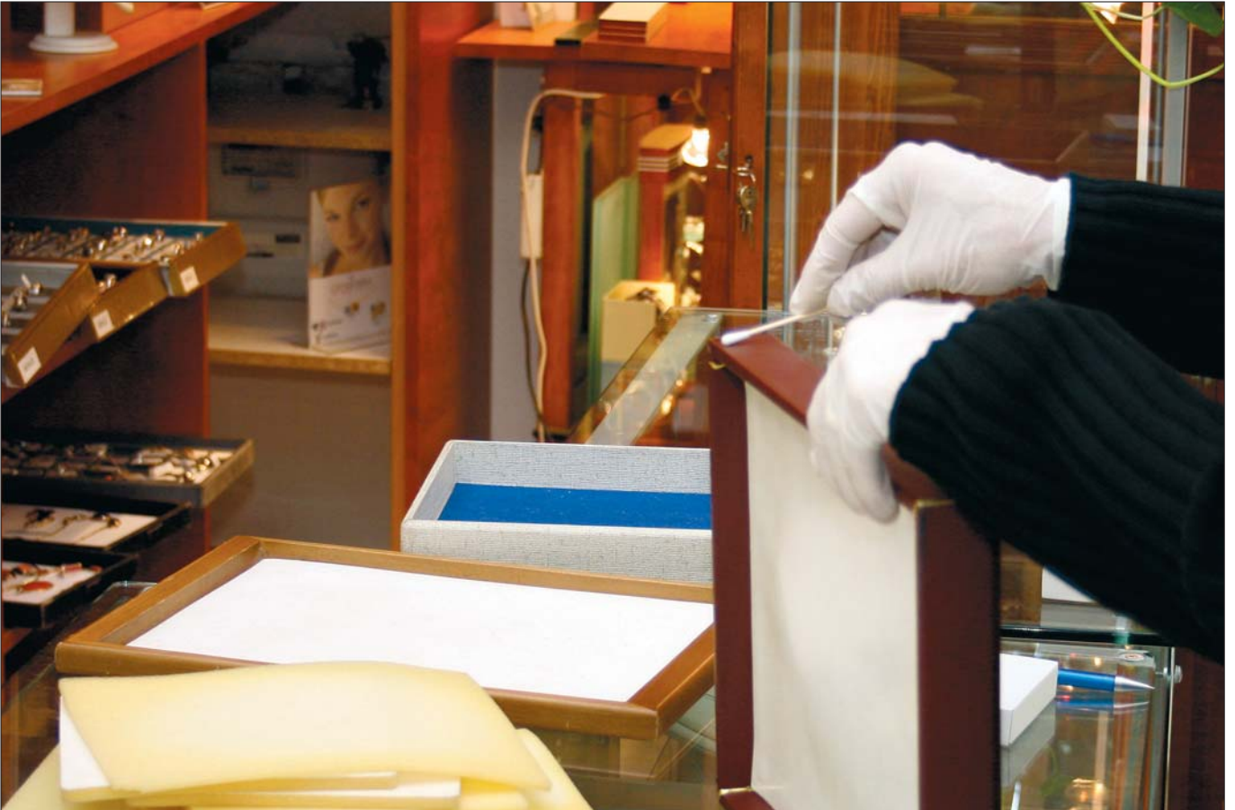
Die Kriminaldienstreform in Wien wird für viele E2a-Beamte im Kriminaldienst ein neues Berufsbild bedeuten.