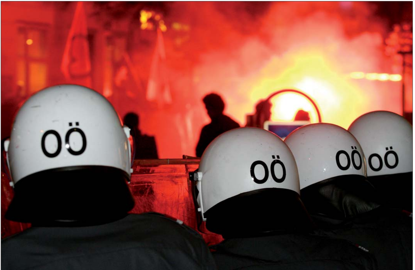
Polizeieinsatz bei einer Demonstration gegen rechte Burschenschafter in Linz: „Der Linksextremismus stellt ebenso wie der Rechtsextremismus keine unmittelbare Gefahr für das politische System in Österreich dar.“