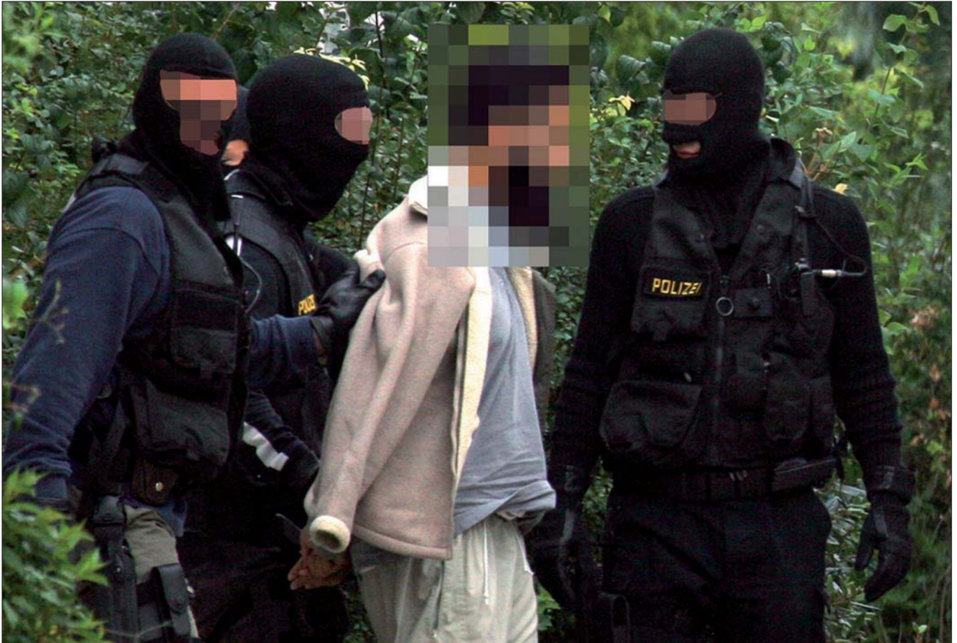
Festnahme eines islamistischen Extremisten in Wien: „Es ist uns ein großes Anliegen klarzustellen, dass wir nicht den Islam als Gefahr sehen, sondern jene, die sich des Islams bedienen und unter diesem Deckmantel Straftaten begehen.“