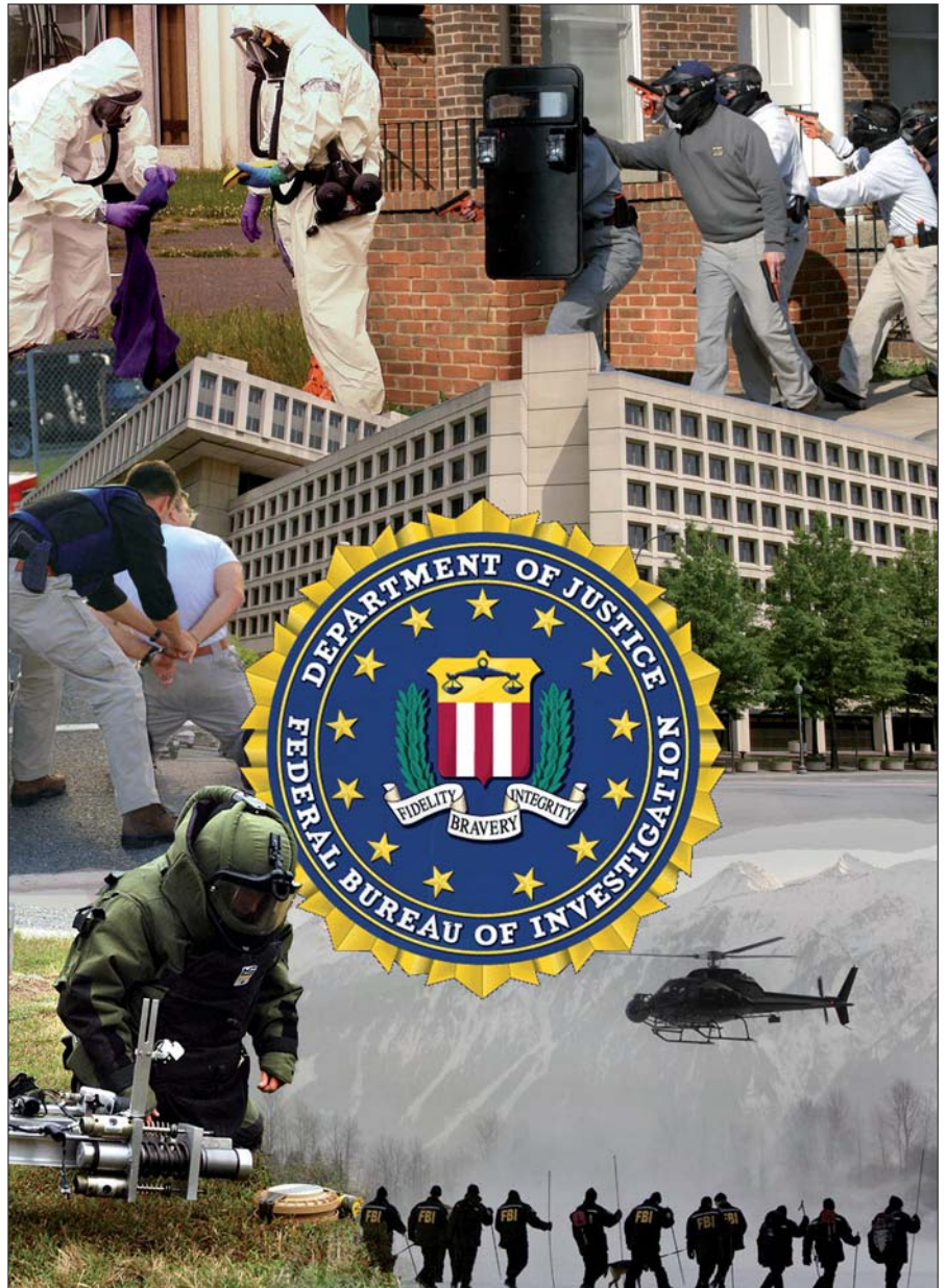
100 Jahre FBI: Offizieller Gründungstag der US-Bundeskriminalpolizei ist der 26. Juli 1908.

Es gibt auch einen Kurs zum Erlernen von Einsatzfahrten. Auf der „Hogans Alley“ werden realistische Polizeilagern trainiert. Es handelt sich um eine funktionsfähige „Übungsstadt“, in der Geschäfte, Lokale, Hotels und