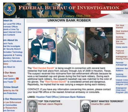
„Most Wanted“ des FBI.

Darüber hinaus erforschen die FBI-Spezialisten Prozesse des kriminellen Denkens, Motive und Verhaltensmuster, um Erkenntnisse für zukünftige Fälle zu erhalten, da ein Großteil des Wissens der Profiler auf „gelebter Erfahrung“ in Verbindung mit wissenschaftlicher Statistik beruht. Die Krisenbereitschaftsgruppe ( Critical Inci-