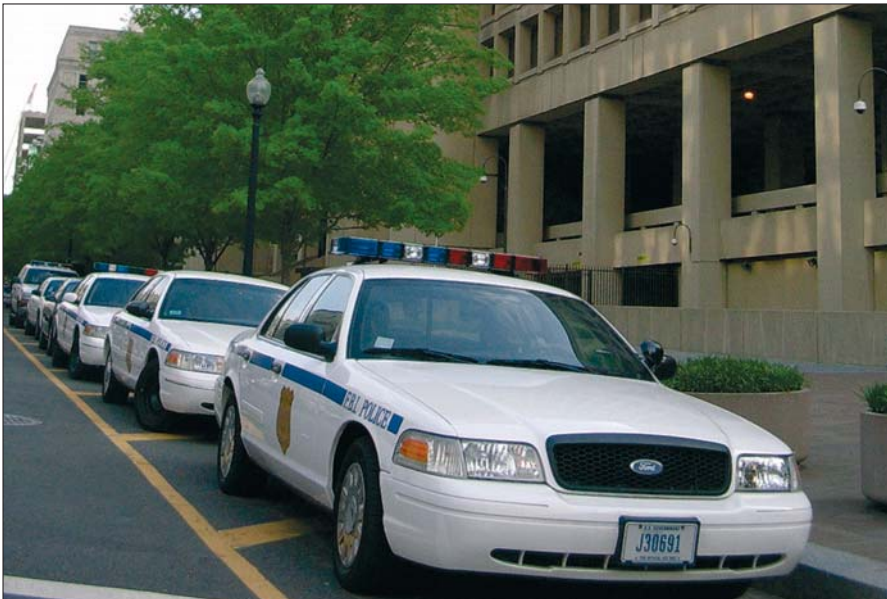
Das FBI verfügt über ein Jahresbudget von drei Milliarden US-Dollar und 28.000 Mitarbeiterinnen und Mitarbeiter.

Informationen und das richtige Verhalten bei Gericht.