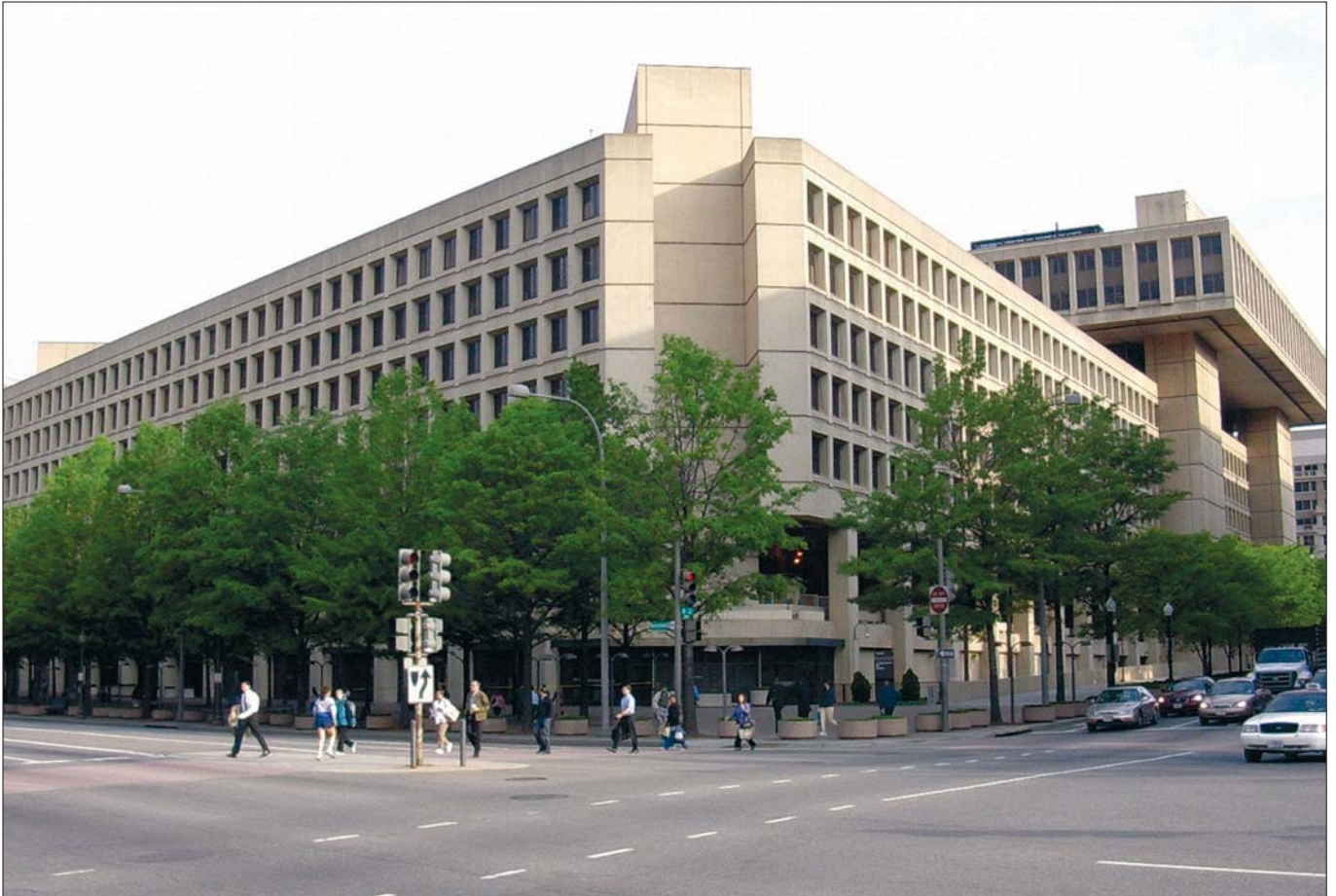
FBI-Zentrale in Washington D. C.: Bewerber brauchen einen Hochschulabschluss und mindestens drei Jahre Berufspraxis.