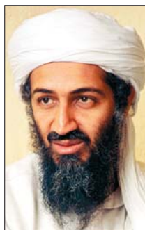
„Bin Laden lebt – in den Köpfen von Hunderttausenden Moslems.“

der alten Al Qaida ausgebildet worden, sondern in Camps im afghanisch-pakistanischen Grenzgebiet. Sie seien nach Europa ausgewandert oder Konvertiten (Bekehrte). Viele von ihnen arbeiteten als unauffällige Bürger im Gastland, beispielsweise jene Ärzte, die in den Anschlag auf den Terminal in Glasgow verwickelt waren. Die Täter seien geprägt vom „Hass auf den Westen und auf unsere Werte“. Österreich sei eher ein Ruheraum als ein Anschlagziel, betonte der Terrorexperte.