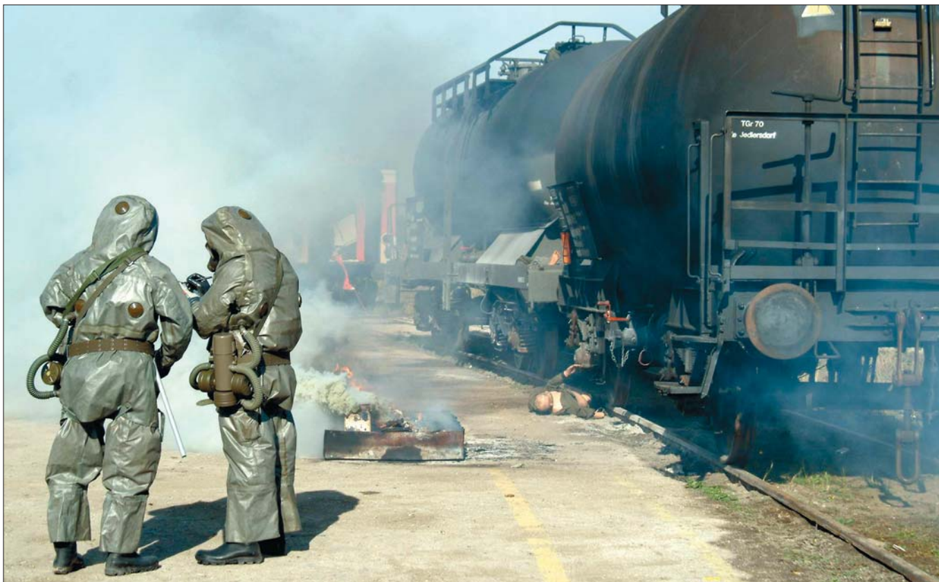
Katastrophenschutzübung: „Die Übung für den Ernstfall sollte unter möglichst realistischen Bedingungen stattfinden.“