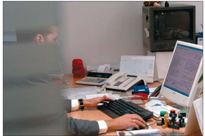
Mitarbeiter: Unternehmensinternes Gefahrenpotenzial.

erzeugen, möglichst aufwendige Gegenmaßnahmen zu provozieren und eine politische und wirtschaftliche Instabilität zu schaffen oder zu vergrößern. Besondere Gefährdungsbereiche seien Ballungszentren, Tourismus, Verkehr und Transport und die Versorgungsgrundlagen der Bewohner: Informationswesen, Energiewesen sowie die Schlüssel- und Nahrungsmittelindustrie. Auch Großveranstaltungen seien besondere Gefährdungsbereiche, aber wegen der Schutzmaßnahmen für Anschläge weniger attraktiv.