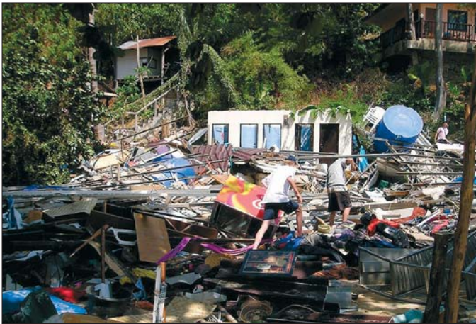
Tsunami: Katastrophen können existenzbedrohend werden.