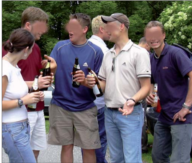
Trinkende Jugendliche: Im Zweifelsfall darf ein Wirt an Jugendliche keine alkoholischen Getränke ausschenken.

Die Behörde begründete dies damit, ein Gastgewerbebetreiber müsse alles in seiner Kraft Stehende unternehmen, um die ihm vom Gesetzgeber auferlegte Verpflichtung einzuhalten, bei Jugendlichen ab dem vollendeten 16. Lebensjahr für eine strikte Einhaltung der Alkoholhöchstgrenze von 0,25 mg/l Atemluft zu sorgen. Der Gastwirt erhob Beschwerde an den Verwal-