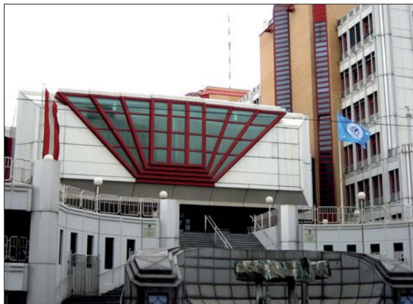
Die Geldwäsche-Meldestelle ist im Referat Wirtschafts- und Finanzermittlungen des Bundeskriminalamts am Josef-Holaubek-Platz in Wien angesiedelt.

Kunden von Immobilienmaklern und gewerblichen Buchhaltern müssen sich legitimieren (ausgenommen reine Interessenten). Neben der neuen Identifizierungspflicht bestehen unter anderem Meldepflichten bei Verdacht auf Geldwäsche, sowie Sorgfaltspflichten und Informationspflichten gegenüber Mitarbeitern. Für Casino-Betreiber, „Money Transmitter“, Notare und Rechtsanwälte bestehen ebenfalls seit 2003 Melde- und Sorgfaltspflichten; für Wirtschaftstreuhandler seit 1. Jänner 2004.