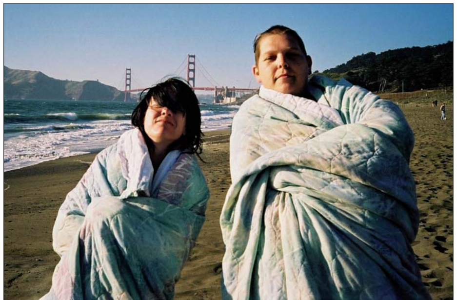
Intersexualität: Im Film „Tintenfischalarm“ von Elisabeth Scharang erzählt Alex über ihr Leben als „Intersexuelle“.

schlechtsmerkmale nicht eindeutig sind, als Khanith bezeichnet. Katoy ist die thailändische Bezeichnung für eine Transfrau oder einen homosexuellen Mann. Katoy s verstehen sich als Frauen in Männerkörpern und streben geschlechtsanpassende Maßnahmen an.