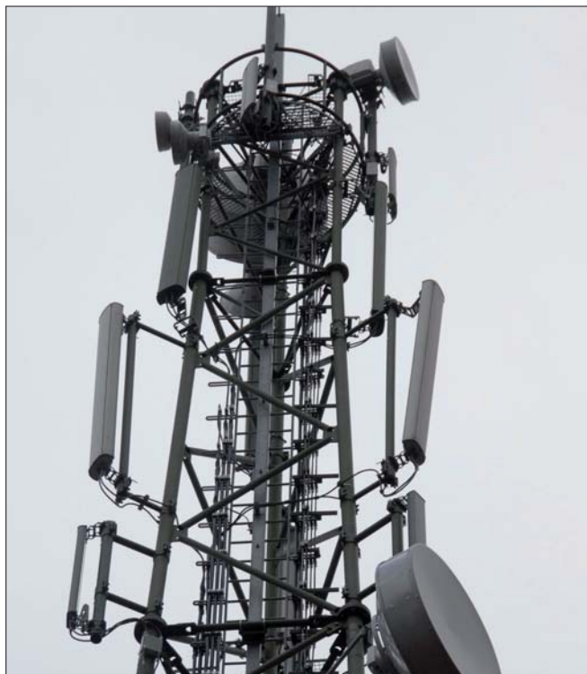
Die Sicherheitsbehörden dürfen bei einer gegenwärtigen Gefahrensituation für Leben oder Gesundheit eines Menschen dessen Standortdaten und IMSI-Nummer erfragen.

Evidenzhaltung von Wegweisungen/Betretungsverboten und einstweiligen Verfügungen zum Schutz vor Gewalt in der Familie und von Betretungsverboten in Schutzzonen: Diese Ermächtigungen zur Führung von Datenanwendungen sollen die bislang großteils in Indexordnern abgelegten Meldungen über Vorfälle von Gewalt in der Familie nach § 38 a ersetzen. Darüber hinaus wird die Möglichkeit zur automationsun-