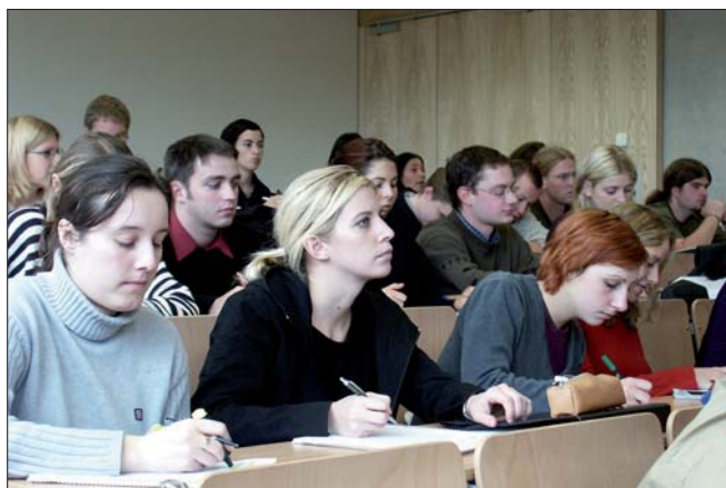
Mit der Anrechnung bestimmter Fachhochschul-Studien als abgeschlossene Hochschulbildung wird durch die Novelle eine weitere Harmonisierung herbeigeführt.

Der bisher vom Bediensteten zu tragende „Eigenanteil“ entfällt ebenso wie die Aliquotierung auf elf Zwölftel, auch das Überschreiten der 20-Kilometer-Grenze zwischen Wohnung und Dienstort hat keinen Einfluss auf die Gebührllichkeit. Wie auch bisher gebührt der Fahrtkostenzuschuss dann nicht, wenn die Voraussetzungen der Gewährung einer Zuteilungsgeld (Zuteilungszuschuss) bzw. Trennungsgeld (Trennungszu-