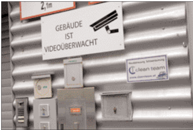
Videüberwachung durch Private: Meldepflichtig, wenn eine Datenanwendung vorliegt.

oder Wohnungen oder von Gebäudefassaden. Die Frage etwa, ob grundsätzlich von einer besonderen Gefährdung durch Wohnungseinbrüche oder Fassadenbeschädigung durch Graffiti auszugehen ist und daher die Videüberwachung des Eingangs- oder Fassadenbereichs von Häusern immer ein „überwiegendes berechtigtes Interesse“ darstellt, muss laut Datenschutzkommission differenziert beantwortet werden: Wesentlich ist zunächst, ob und wie weit durch die Überwachung auch der öffentlicher Raum betroffen ist, etwa der Gehsteig vor dem Haustor; dies ist nur im Ausnahmefall zulässig. Es wird daher zum Beispiel einer den Eingang vom Hausinnern her überwachenden Anlage der Vorzug zu geben sein vor