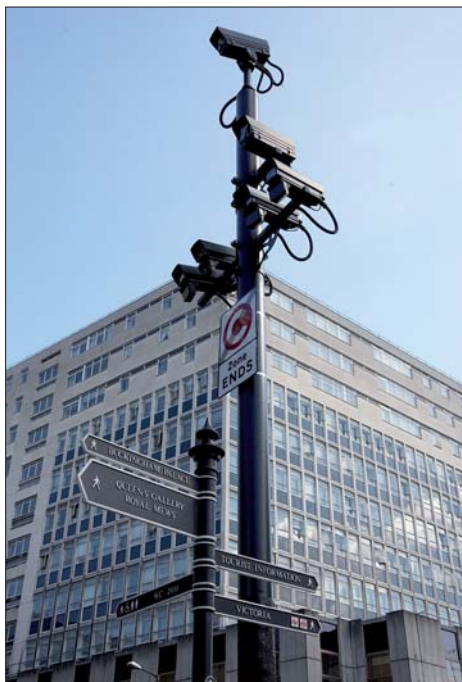
In Großbritannien sind Videoüberwachungsanlagen seit den 1980er-Jahren sehr verbreitet.

Öffentliche und private Orte. Ein „öffentlicher Raum“ ist jener Bereich, in dem sich jedermann „grundsätzlich unbeschränkt“ aufhalten darf und eine Zutrittskontrolle rechtlich nicht oder nur aus besonderem Anlass zulässig ist – dies betrifft etwa Straßen, Plätze und die freie Natur. Ein „beschränkt öffentlicher Raum“ ist jener Bereich, in dem zwar ein privatrechtliches Verfügungsrecht über die Örtlichkeit besteht, die Berechtigung des Zutritts jedoch nicht auf von vornherein bestimmte Personen beschränkt ist (etwa Schüler einer Schule oder Patienten). Demgegenüber stehen Örtlichkeiten, zu denen der Zutritt nur bestimmten Personen gestattet ist, z. B. den