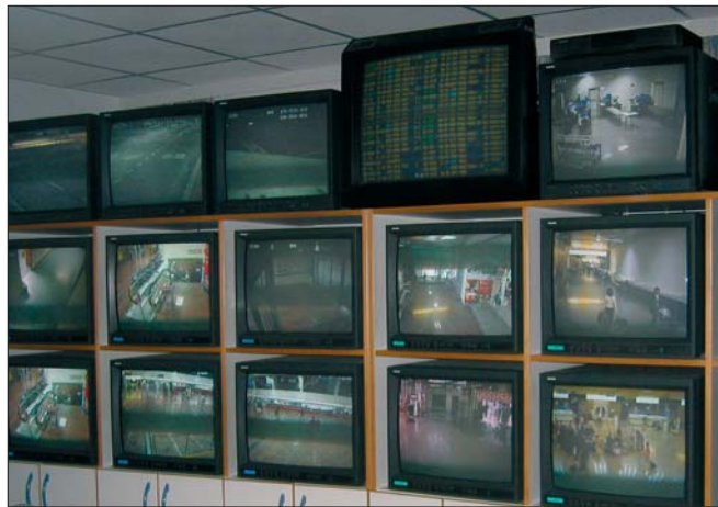
Flughafen Wien-Schwechat: Mehr als 300 Videokameras.

Personenbezogene Daten. Die Bilddaten sind dann personenbezogene Daten, wenn die Kameraeinstellung es grundsätzlich erlaubt, die aufgenommenen