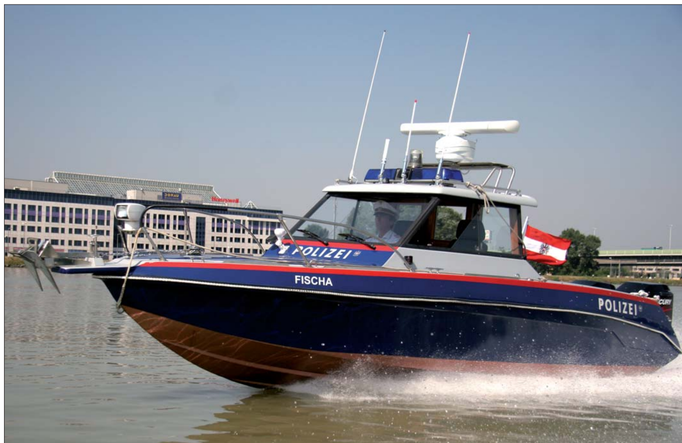
Der Polizeidienst auf dem Wasser erfolgt in Wien durch die Mitarbeiter der Polizeiinspektion Handelskai/See- und Stromdienst.