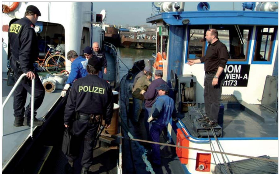
„Grenzkontrollstelle Wien“: Beamte des „See- und Stromdienstes“ bei der Kontrolle eines Frachters im Bereich Praterkai.

nierten Kriminalität, die uns immer mehr zu schaffen macht“, sagt Kraus. Die Polizei ist gegen die Tricks der Tätergruppen meist machtlos. Es gibt keine zentrale Erfassung der zugelassenen Boote. Für die Registrierung der Wasserfahrzeuge sind neun Landesbehörden zuständig. Die sind jedoch nur zu den Dienstzeiten besetzt.