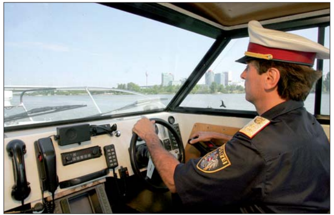
Sämtliche Polizisten des See- und Stromdienstes haben die Ausbildung zum Polizeischiffsführer absolviert.

Der Wendeanzeiger fixiert die Richtung, in die es gehen soll, mit einem Kreisel und zeigt Abweichungen an, die sich im Bereich von Zehntelgraden abspielen.