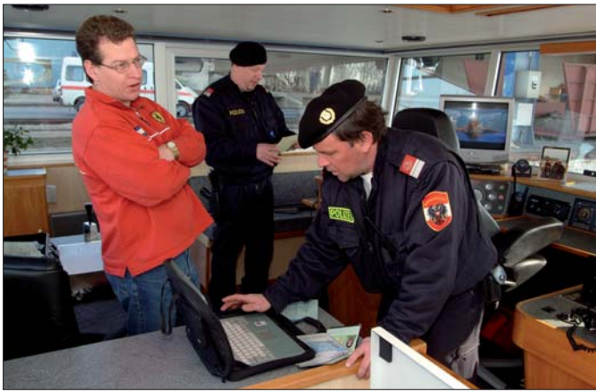
Bootskontrolle: Polizisten überprüfen Papiere und Dokumente des Bord-Personals.