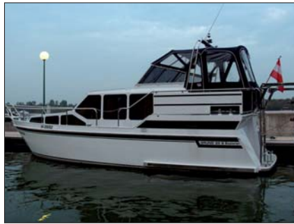
Begehrte Beute: Die Polizei registriert eine Zunahme von Bootsdiebstählen.

Jährlich gibt es etwa 600 Einsatzfahrten mit den Polizeibooten. Seit Bestehen der PI seit 1957 konnten die Beamten 377 Menschen das Leben retten, die zu ertrinken drohten. Die Zahl der