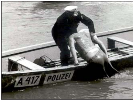
Lebensrettung „anno dazumal“, durch einen Beamten der „Strominspektion“.

Kapitänspatent zur See. Für das große Kapitänspatent sind neben einer theoretischen Ausbildung 24 Monate Fahrpraxis Voraussetzung; für ein Patent, mit dem 20-Meter-Boote gelenkt werden dürfen, sind zwei Monate Praxis gefordert. Diese Praxis erwerben die Beamten unter anderem auf privaten Großschiffen, wie dem „Eisvogel“, ein Eisbrecher des Wiener Hafens, oder der „Vindobona“, einem Passagierschiff der DDSG-Blue-Danube. Dort fahren sie unter Aufsicht eines Berufskapitäns der DDSG. „Dieses praktische Erfahren des Kapitänlebens ist nötig, um zu verstehen, wie ein Kapitän denkt“, sagt Erich Kraus. Die Beamten