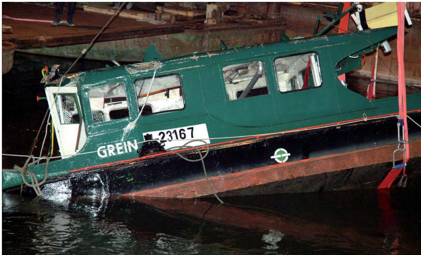
Bergung des Motorboots „Grein“: Bei der Kollision des Schiffs mit dem Schubverband „Meister 2“ am 4. November 2004 in Wien starben sechs Besatzungsmitglieder.