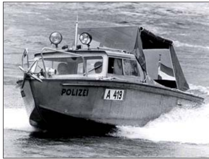
1984 hatte der Donaudienst ein Aluminiumboot im Einsatz – die „Donau“.

Kapitänspatent zur See. Für das große Kapitänspatent sind neben einer theoretischen Ausbildung 24 Monate Fahrpraxis Voraussetzung; für ein Patent, mit dem 20-Meter-Boote gelenkt werden dürfen, sind zwei Monate Praxis gefordert. Diese Praxis erwerben die Beamten unter anderem auf privaten Großschiffen, wie dem „Eisvogel“, ein Eisbrecher des Wiener Hafens, oder der „Vindobona“, einem Passagierschiff der DDSG-Blue-Danube. Dort fahren sie unter Aufsicht eines Berufskapitäns der DDSG. „Dieses praktische Erfahren des Kapitänlebens ist nötig, um zu verstehen, wie ein Kapitän denkt“, sagt Erich Kraus. Die Beamten