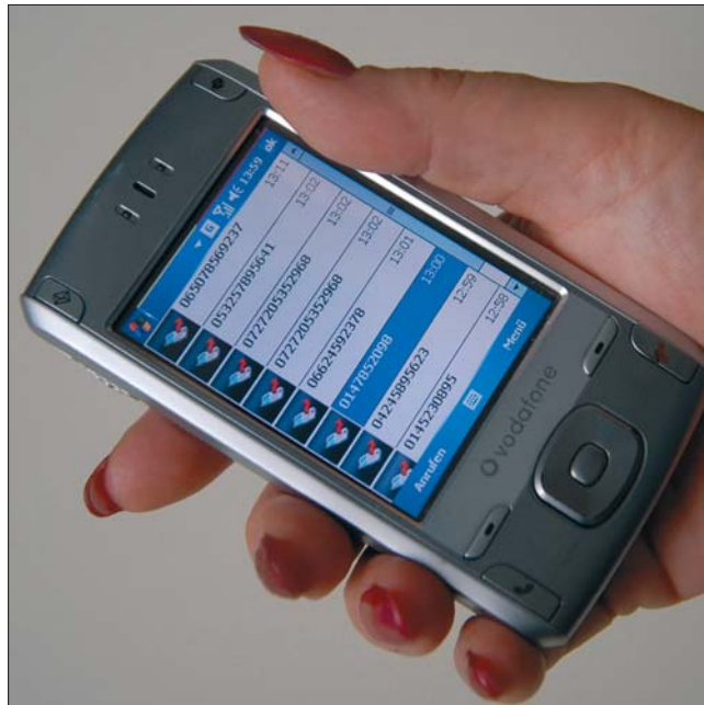
„Verbindungsdaten“: Rufliste in einem Mobiltelefon.

Der OGH hielt dazu fest, dass das Adressverzeichnis in einem Mobiltelefon, in dem Namen und Telefonnummern von Personen gespeichert sind, nichts anderes als ein elektronisches Adressverzeichnis ist und der Blick in ein Adressverzeichnis, um eine Telefonnummer zu erfahren, nicht den Wortlaut der Definition der Überwachung einer Telekommunikation erfüllt. Auskunft wird nur über Stammdaten (Name, Anschrift, Teilnehmernummer) gegeben, die ohne Telekommunikationsverbindung zum Netzbetreiber verfügbar sind. Werden die Daten aus einem Mobiltelefon gelesen, handelt es sich bloß um einen Blick in ein Verzeichnis, das aus Praktikabilitätsgründen auf dem Mobiltelefon angebracht ist. Das verändert aber nicht den Charakter der Daten (gemeint ist damit, dass es sich um keine Ruf- oder Inhaltsdaten handelt) und insofern dürfen diese Daten