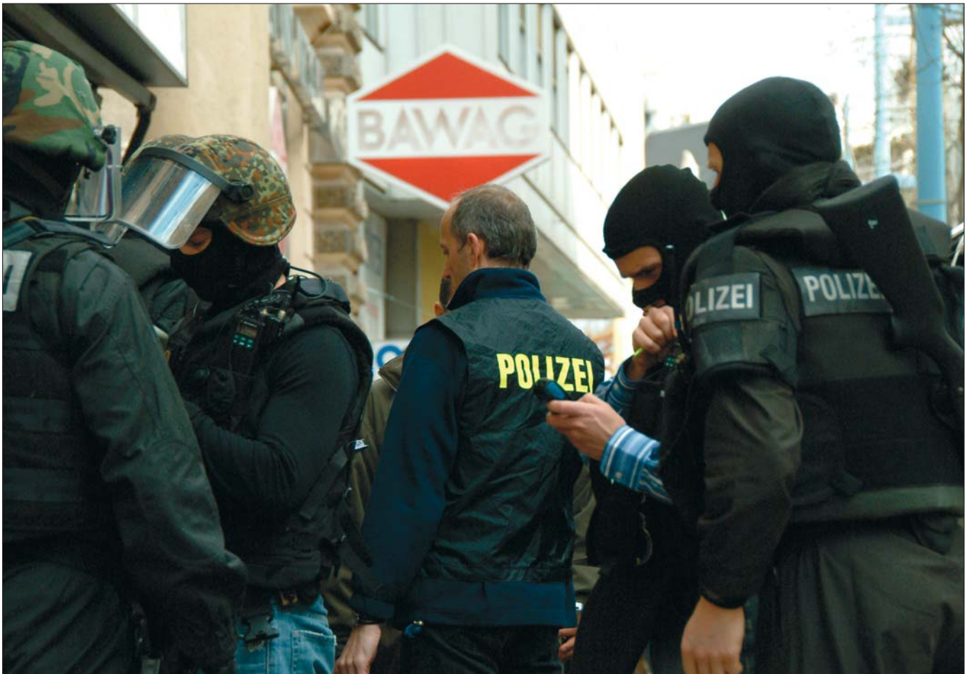
Polizeinsatz bei einer Geiselnahme in der Mariahilfer Straße in Wien: Bei einer Geiselnahme darf die optische und akustische Überwachung am Ort der Freiheitsbeschränkung von der Kriminalpolizei aus eigenem vorgenommen werden.

Eine EU-Richtlinie (Vorratsspeicher-RL/Data-Retention-RL) verpflichtet die EU-Mitgliedstaaten hinsichtlich dazu, innerstaatlich eine Regelung zu schaffen, nach der Verkehrsdaten auf Vorrat zu speichern sind.