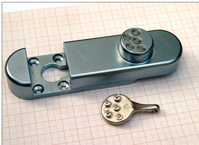
Geminy-Schloss mit charakteristischem „Pfannenschlüssel“.