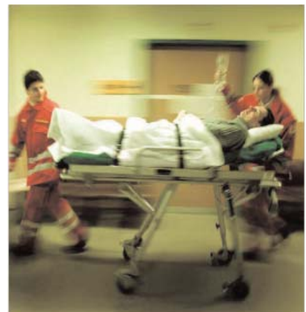
Nach Unfällen sind manchmal auch junge Menschen plötzlich in ihrer geistigen Flexibilität eingeschränkt.

Rund 50.000 Österreicher haben einen Sachwalter, weil sie ihre Rechtsgeschäfte nicht mehr alleine tätigen können. Altersdemenz, psychische Erkrankungen oder Unfälle sind Auslöser dafür, dass man plötzlich nicht mehr in der Lage ist, wichtige Entscheidungen für sich selbst zu treffen.