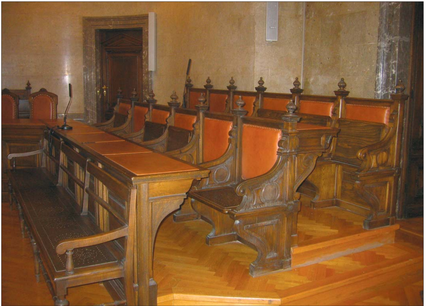
Geschworenenbank im Schwurgerichtssaal des Landesgerichts Wien.

Geschworene und Schöffen tragen eine große Verantwortung. Sie sind vom Gesetz zur Mitwirkung an den Strafprozessen berufen, in denen bis zu lebenslange Freiheitsstrafen verhängt werden können.