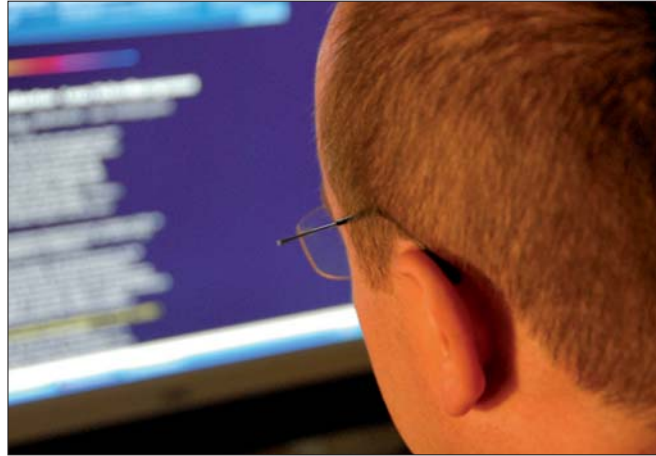
Alle Vorgänge im Internet hinterlassen Spuren im Netz, die zu einem Benutzerprofil zusammengesetzt werden können.

Weniger bekannt ist, und darauf hat Christian Russ (Universität Klagenfurt) hingewiesen, dass bei Anfragen in Suchmaschinen eine Benutzer-ID in Form eines Daten-Cookies am Rechner des Anfragenden abgelegt wird. Mit den vielfältigen anderen Diensten, die über reine Suchfunktionen hinaus angeboten werden, eröffnen sich Möglichkeiten eines Data-Minings, die letztlich ein Bild über den User ergeben. Aus der