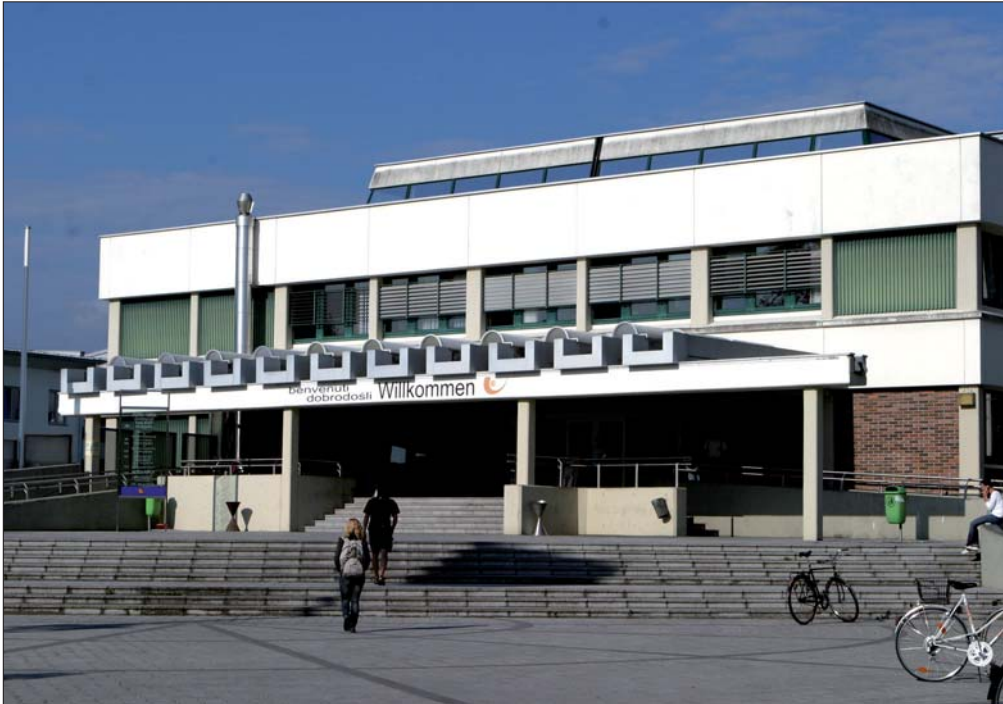
Universität Klagenfurt: Seit 2003 findet hier jährlich die „D.A.CH Security“ statt.

Bis dahin könnte ein biometrisches Merkmal in ein Informationssystem eingespeichert und vom behandelnden Arzt verifiziert werden. Ansonsten kann die E-Card eine sichere Datenübertragung gewährleisten, wenn die auf der Karte enthaltene Funktion der Bürgerkarte aktiviert wird. Dies kann kostenlos über das Internet durchgeführt werden und bewirkt eine über die (eindeutige) ZMR-Zahl des Melderegisters erfolgende Personenbindung und ermöglicht eine Verschlüsselung von Daten sowie auch die digitale Signatur elektronischer Dokumente in Form der Verwaltungssignatur, die nach der Verwaltungssignaturverordnung (Verw-SigV) bei Bürgerkartenanwendungen bis 31. Dezember 2007 der sicheren Signatur gleichgestellt ist.