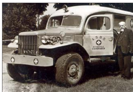
Eines der ersten Einsatzfahrzeuge des damaligen Arbeiter-Samariterdienstes.

Der ASBÖ reagierte auf die gesellschaftlichen Veränderungen der folgenden Jahrzehnte: Das Rettungswesen und der Krankentransport wurden um