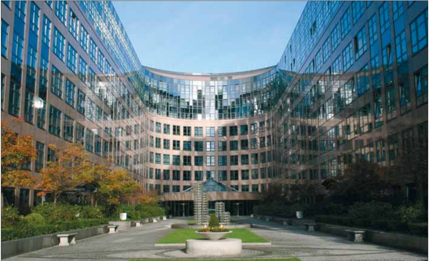
Bundesministerium des Innern in Berlin: „Neue Dimension der Gefährdung durch islamistische Terroristen.“