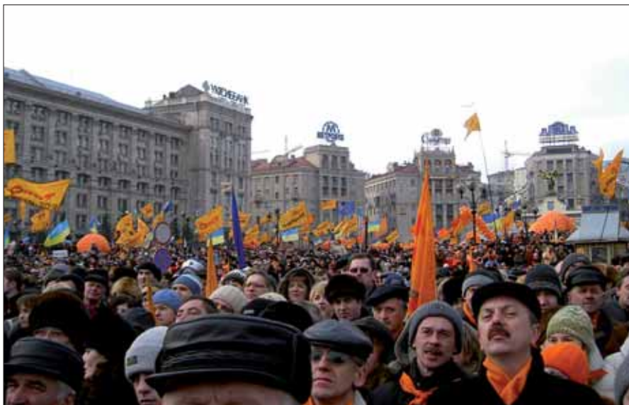
„Orange Revolution“ im Herbst 2004: Eine Massenbewegung demonstrierte für eine demokratischere, freiere und gerechtere Gesellschaft.