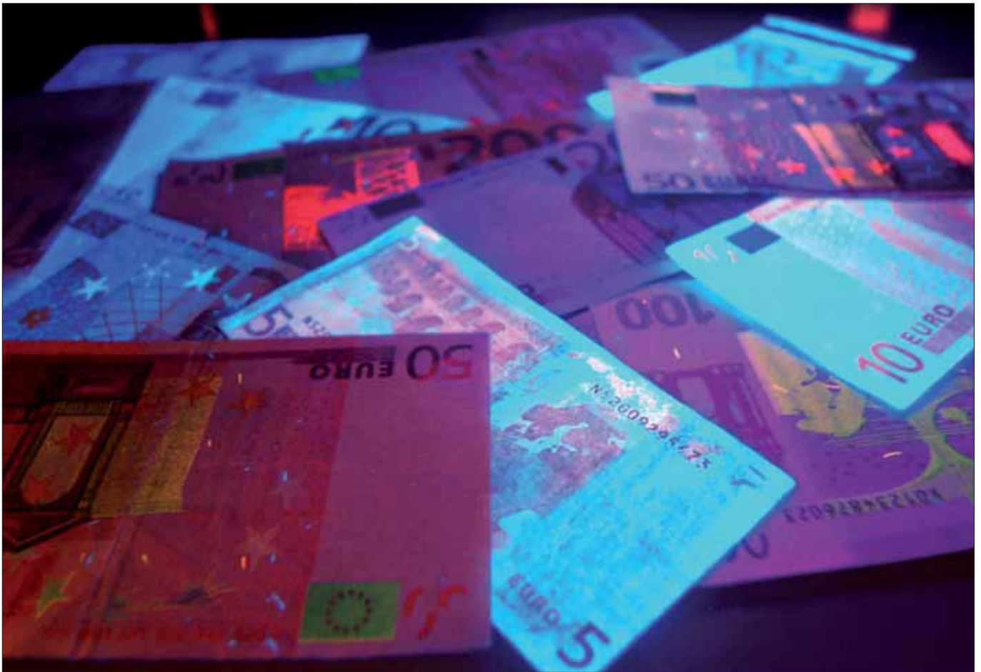
Geldwäsche: Verschleierung kriminell erlangten Vermögens.