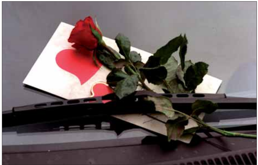
Die „verliebten Stalker“ fahren vor dem Haus des Opfers auf und ab, verfolgen es im Supermarkt, legen ihm Rosen vor die Tür oder auf das Auto.

„Prominentenstalking“. Ein eigenes Kapitel ist das „Prominentenstalking“. Madonna wurde schon von mehreren Stalkern verfolgt. Der erste Stalking-Paragraf wurde 1991 in Kalifornien im Strafgesetz eingeführt, nachdem die TV-Schauspielerin Rebecca Schaeffer 1989 von einem „Fan“ ermordet worden war. Einem Stalker der Schauspielerin Nicole Kidman verbot ein Richter