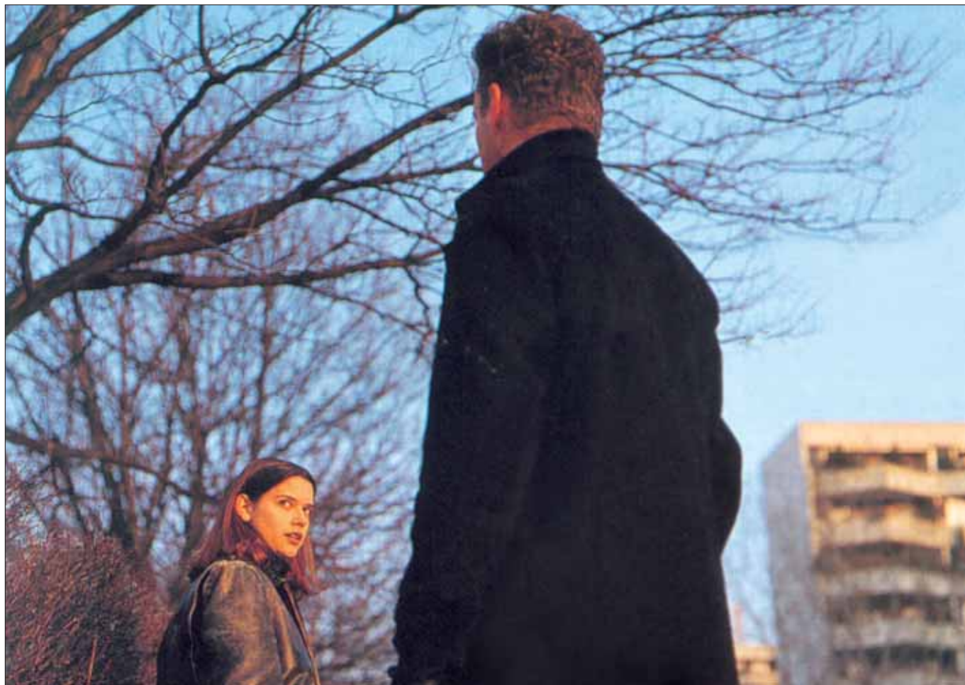
Immer wieder taucht der „Stalker“ unerwartet auf.