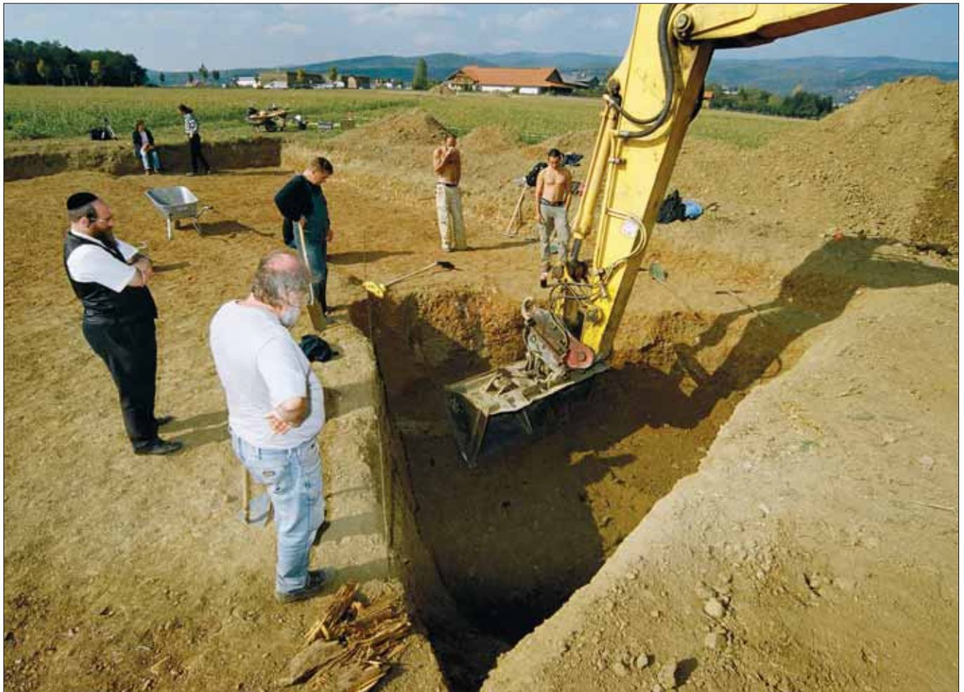
Vermutetes Massengrab mit 180 Opfern des nationalsozialistischen Regimes: Grabungsarbeiten im Burgenland.

war seit jeher von der jeweiligen Kultur oder den mit der Bestattung zusammenhängenden Umständen abhängig, wie etwa Massengräber anlässlich von Seuchen. Demnach ist ungeachtet der äußeren Form von einem Grab zu sprechen, wenn es dazu dient, den Leichnam eines Menschen aufzunehmen. Insoweit kann davon ausgegangen werden, dass alle Orte, an denen die Leichname von Menschen, die zu den in § 1 KGFG 1 und in § 1 KGFG 2 genannten Personengruppen gehörten, Kriegsgräber im Sinne dieser Gesetze sind.