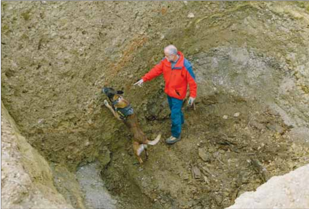
Einsatz eines Leichensuchhundes bei der Suche nach dem Massengrab im Burgenland.

Maßnahmen, die diesem Ziel dienen, kann er nicht erfolgreich einwenden, dass dies seinem Eigentumsrecht widerspricht. Diese Verpflichtungen sind eine öffentliche Last, die ohne Anspruch auf Entschädigung von einem Grundeigentümer zu tragen ist 12 .