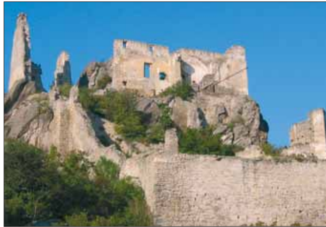
Kuenringer-Festung Dürnstein: Hier wurde König Richard Löwenherz 1192/93 festgehalten.

Ein weiterer Auslöser für die Feindschaft war ein Polit-Mord in Palästina. Der italienische Kreuzfahrer Konrad von Monferrat, ein Verwandter Heinrichs VI., wurde mit Zustimmung der Deutschen und Franzosen zum „König von Jerusalem“ und damit zum Herrscher über das Heilige Land ausgerufen; ein Amt, das der impulsive Richard Löwenherz für sich beanspruchte. Kurz darauf wurde Konrad von Monferrat erstochen. Die Mörder gestanden, von Richard Löwenherz zur Tat angestiftet worden sein. Die Aussage wurde nicht als Beweis zugelassen. Offenbar