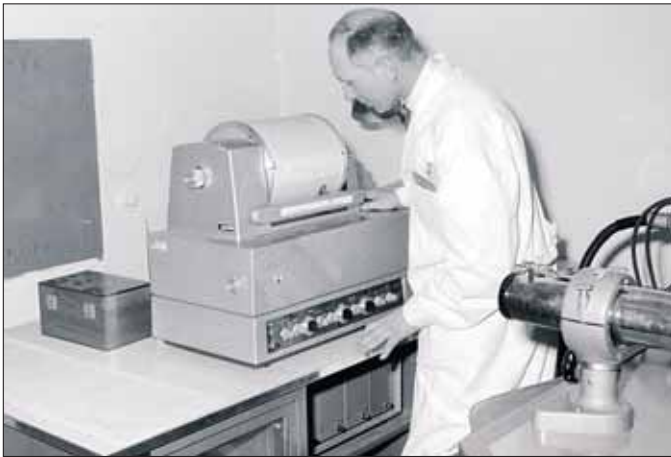
Mitte der 60er-Jahre „High-End-Technik“: IR-Spektrometer zur Identifizierung von organischen Stoffen.