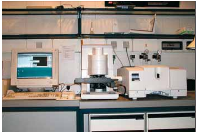
„High-End“ 2007: Mikro-IR-Spektrometer zur Untersuchung kleinster Proben, z. B. Lacksplitter, kleiner als 0,05 mm.

bruck, Klagenfurt und Graz ab 1963 kriminaltechnische Untersuchungsstellen eingerichtet wurden. Deren Mitarbeiter wurden von der nunmehrigen Abteilung II/16 (Kriminaltechnik) des Innenministeriums ausgebildet; sie erhielten bis 1965 eine moderne Ausrüstung und Fahrzeuge für die Tatortarbeit.