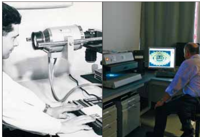
Untersuchung von Dokumenten: mit Bildwandler Mitte der 60er-Jahre – mit optischen Methoden 2007.

anderem die Errichtung von kriminaltechnischen Stellen in den Landeshauptstädten vorgesehen; die Pläne waren mit dem Ende des Deutschen Reichs und der Wiedererrichtung der Republik Österreich hinfällig.