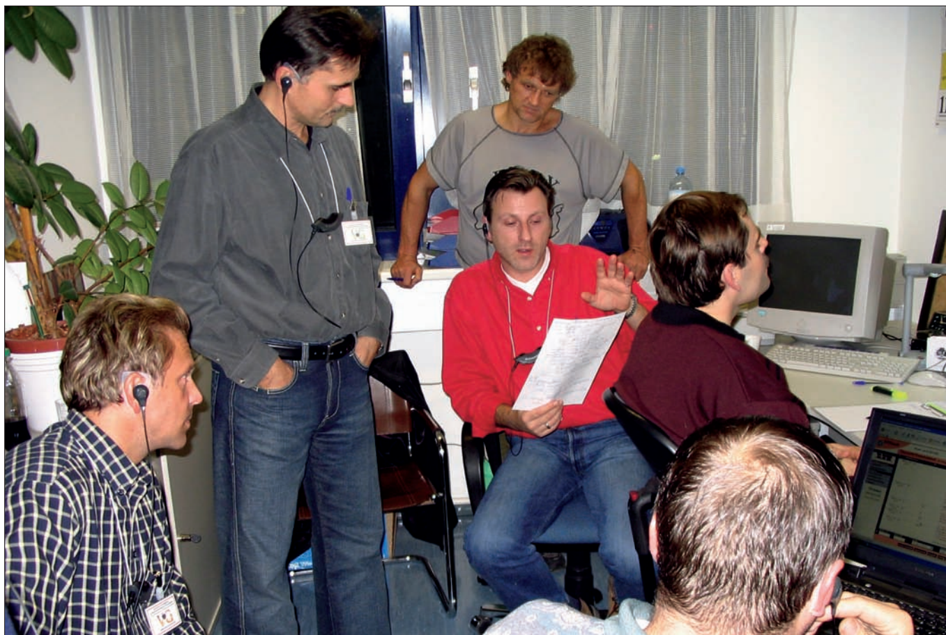
Angehörige der Verhandlungsgruppe bei einer Teambesprechung.