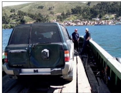
Angehörige der Verhandlungsgruppe Wien bei der Suche nach vermissten Österreichern in Bolivien.

Anforderungen. Verhandler werden aus allen Bereichen der Exekutive rekrutiert (uniformierte Kräfte, Kriminaldienst, Technik und andere). Sie nehmen ihre Tätigkeit als VG-Mitglieder neben ihren sonstigen dienstlichen Aufgaben wahr. Eine Vorauswahl wird von den einzelnen Leitern der Verhandlungsgruppen getroffen. Hier ist neben objektiven Kriterien ein persönlicher Eindruck wesentlich, weil die neuen Mitglieder in das bestehende