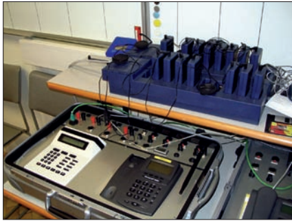
Technische Ausrüstung der Verhandlungsgruppen.

mit einem gesuchten Mörder solange am Telefon, bis er seinen Aufenthaltsort in Wien bekannt gab und sich der Polizei stellte.