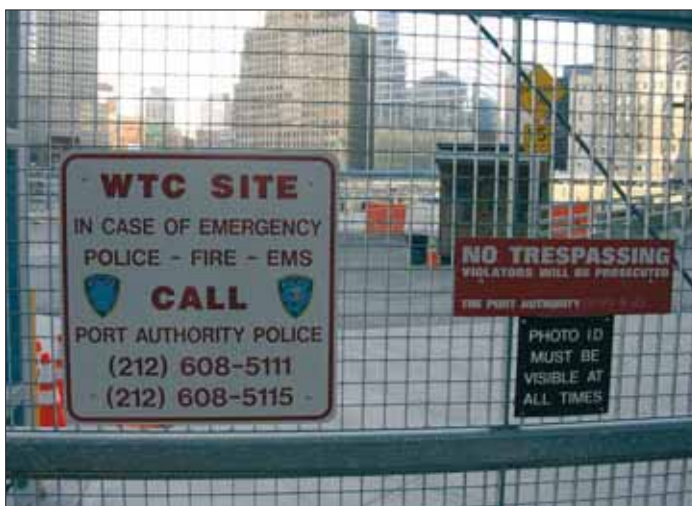
„Grond Zero“ in New York: Terrorismus ist eine größere Bedrohung geworden, als sie noch vor einigen Jahren war.

„Die Terminologie des Terrorismus, der Terrorismusabwehr und der Terro-