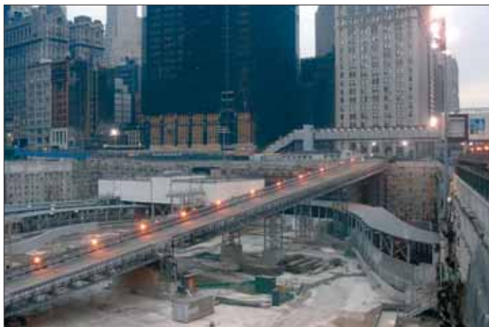
Berichte in den Medien über den Terror und seine Folgen haben einen höheren Stellenwert erhalten.

• Viertens können ähnlich geschriebene und klingende Benennungen zu Missverständnissen führen: Insbesondere Laien könnten etwa die Benennungspaare „präventiver Krieg“/„präemptiver Krieg“ oder „psychologische Kampfführung“/„psychologische Kriegsführung“ auf Grund ihrer Ähn-