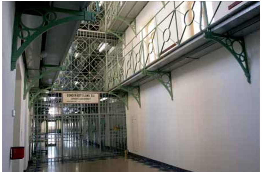
In Österreich ist es für Häftlinge nicht gerichtlich strafbar auszubrechen.

Auf Antrag des Anstaltsleiters kann der zuständige Richter verfügen, dass eine Hausarrestzeit nicht auf die Haft angerechnet wird. Das wäre ein Fall, in dem sich eine Gefängnisstrafe durch einen Fluchtversuch verlängert. Auch