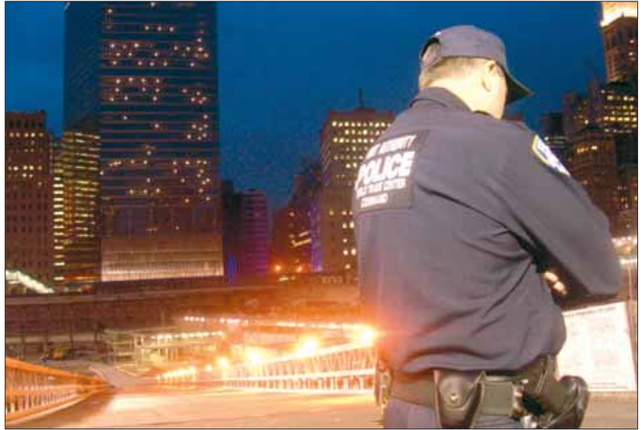
Im Bereich des „Ground Zero“ soll der „Freedom Tower“ entstehen. Bereits eröffnet wurde das neue „Building 7“ (links).

Zwischen 23. Juni und 23. August 1993 wurden 15 Personen vom JTTF New York verhaftet. Im Visier der festgenommenen muslimischen Gruppe standen damals etwa das UN-Hauptquartier, die FBI-Zentrale und zwei wichtige Verkehrsachsen unter dem Hudson River: der Lincoln- und der Holland-Tunnel. „Die Vereitelung dieser Anschläge war das Ergebnis mehrjähriger Ermittlungen, die bis nach Afghanistan und Pakistan führten,“ erklärt der FBI-Agent. Viele juristische Schranken, die vor 13 Jahren die Einleitung von Untersuchungen verhinderten oder erschwerten, existieren nicht mehr seit der Einführung des Patriot Act – der Anti-Terror-Gesetzgebung der U.S.-Regierung vom Oktober 2001, die im März 2006 mit Adaptierungen vom Kongress bestätigt wurde. „Damals mussten wir an eine Verletzung der Neutralitätsgesetze anknüpfen, um unsere Erhebungen gegen die Verdächtigen beginnen zu können. Heute wäre die Situation wesentlich einfacher“, präzisiert Anticev, der als führender Agent bei der Zerschlagung des Bom-