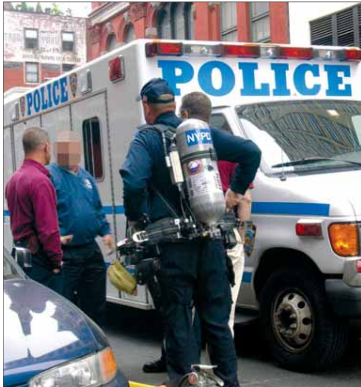
Einsatz nach Bombenalarm: „Die Bedrohung ist nach wie vor real.“

Über die vor allem in Fernsehsendungen oft dargestellten Klischees, die Konflikte zwischen örtlicher Polizei und dem FBI zeigen, schüttelt der Agent den Kopf: „Die Zusammenarbeit funktioniert problemlos. Wenn wir zum Beispiel innerhalb der Grenzen eines New Yorker Polizeireviers eine Verhaftung vornehmen, setzen wir den zuständigen Kommandanten sofort in Kenntnis. Wir haben sogar Funkgeräte mit der lokalen Polizeifrequenz dabei.“