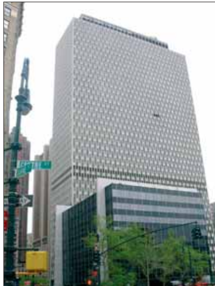
FBI-Büro in New York: Viele Ressourcen wurden noch mehr in Richtung Terrorismus verlagert.

Operation Nexus. Verdächtige Machenschaften von Terroristen lassen sich oft bereits an ungewöhnlichen Kaufpraktiken erkennen. Im Rahmen der Operation Nexus steht die New Yorker Polizei in Kontakt mit Geschäftsleuten, die einem bundesweiten Netzwerk angehören. Nach den Anschlägen auf das Nahverkehrssystem in London am 7. Juli 2005 erhielt das NYPD den Hinweis, dass die Bomben mit einem auf Hydrogen-Peroxid basierenden Bestandteil gefertigt worden waren, der unter anderem aus Haarbleichmitteln hergestellt werden kann. Über den Nexus-Verband konnte herausgefunden werden, welche Händler diese Substanzen anbieten und es wurde ein Meldesystem für zukünftige Kaufaktionen installiert. Derzeit steht die Exekutive mit 20.000 Firmen und Betrieben in Kontakt.