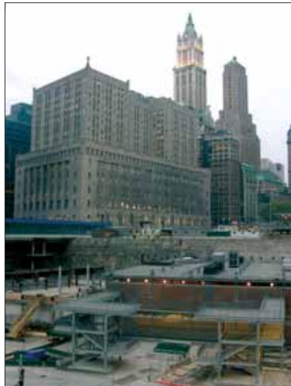
Grube am „Ground Zero“: Nach wie vor ein offener Kriminalfall.

Der Geländewagen des PAPD fährt eine massive Rampe hinunter, auf der jährlich am 11. September Gedenkmärsche aus Sicherheitskräften und Angehörigen der Anschlagsoffer vorbei ziehen. Auf der untersten Ebene der Grube biegt das Fahrzeug in einen Trakt ein, der zu einem alten Eisenbahnsystem gehörte. Einige der tiefer gelegenen Ebenen des World Trade Center und Gleisanlagen sind nach dem Einsturz sehr gut erhalten geblieben. In Spitzenzeiten waren im Welthandelszentrum