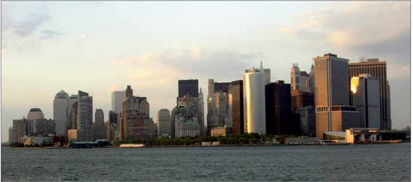
Veränderte Skyline von Manhattan: Mahnmal der Terrorereignisse.

NYPD und der Feuerwehr in ihren Fahrzeugen raschen Online-Zugang zu Strafdaten, Fingerabdrücken oder Gebäudeplänen verschaffen soll.