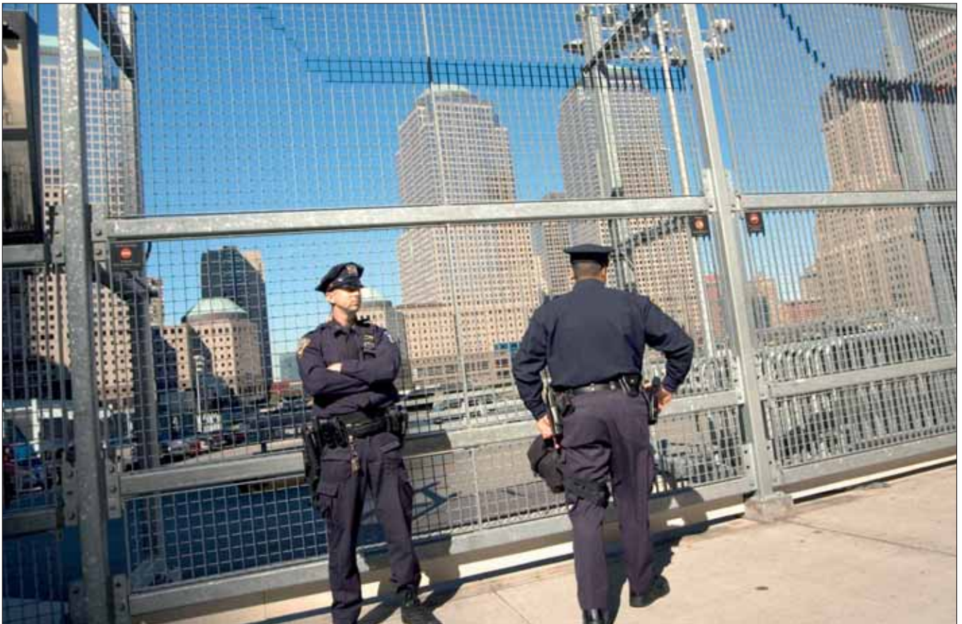
Sicherheitsposten am „Ground Zero“: Rund 1.000 Polizisten sind in New York ständig für die Terrorbekämpfung abgestellt.