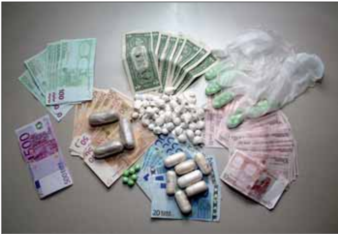
Sichergestelltes Suchtgift und Bargeld: Trotz Preisverfalls bringt der Suchtgifthandel den Kriminellen hohe Gewinne.