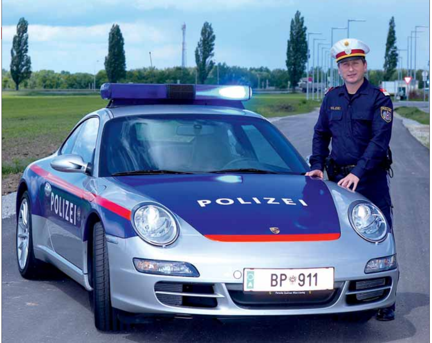
Porsche 911 auf Streife: Der Sportwagen wird im Rahmen eines Tests auf den Autobahnen gegen Raser eingesetzt.