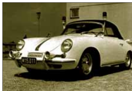
In den 60er- und 70er Jahren gab es bei der Gendarmerie Verkehrsstreifen mit Porsche -Sportwagen.

Seit dem Jahr 1910 gibt es Automobile bei der Sicherheitsexekutive. Damals wurden bei der Wiener Polizei drei Kraftfahrzeuge für Kommandan-