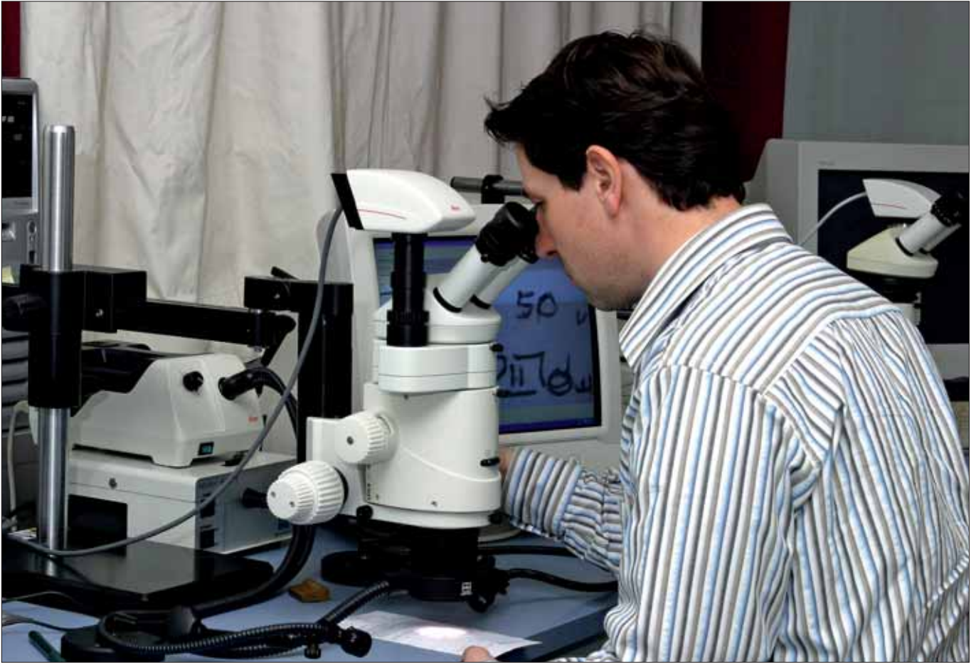
Handschriftenexperte des Bundeskriminalamts: Untersuchung eines gefälschten Rezepts.