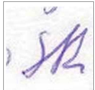
Rezeptfälschung: Graphische Merkmalsübereinstimmung bei der Handschrift auf drei gefälschten Rezepten.

Rezeptscheine. Diese Rezepte wurden von ihr auf suchtgiftigkeits Medikamente ausgestellt, wobei sie Stempel und Unterschrift der Ärzte fälschte und anschließend in Apotheken einlöste. Das ging über sechs Jahre gut. Nach den Anzeigen durch die Apotheken