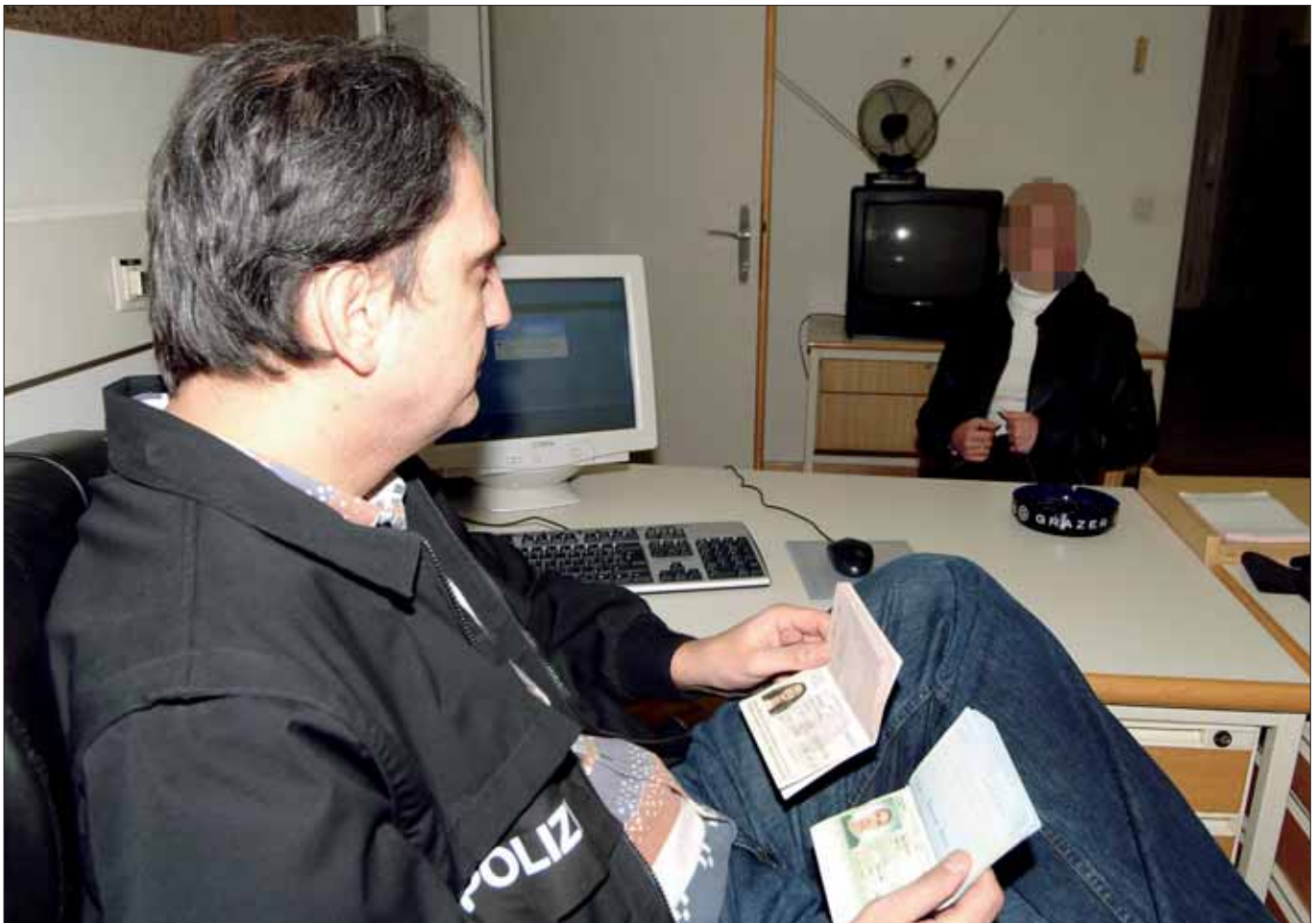
Befragung einer Festgenommenen nach einer Rotlichttrazzia.