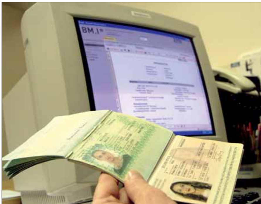
Überprüfung von Reisedokumenten: Eine Rumänin hatte einen gefälschten tschechischen Pass.

laufen.“ Durch ständige Razzien und Verhaftungen hat die Polizei laut Preiszler den Dealern den Boden für den Straßenhandel entzogen. „Heute versuchen die Dealer, fixe Geschäfte aufzubauen, und zwar ausschließlich in Wohnungen, Callcenters oder Lokalen“, sagt Preiszler. „In Straßen, wo früher fünfzig bis siebzig Drogenhändler verkehrt sind, trifft man heute nur noch zwei bis drei an – auch im Sommer. Die großen Suchtgiftszenen wie der Schwedenplatz oder der Votivpark sind eliminiert.“