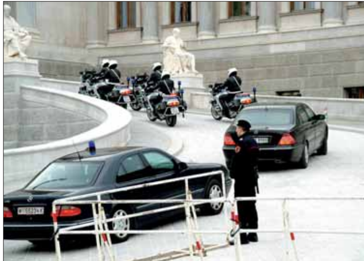
Sicherheitsvorkehrungen bei der Islamkonferenz in Wien.

Die Notwendigkeit, den Islam und Muslime im Staat zu integrieren, bestand schon für die damalige Österreich-Ungarische Monarchie aufgrund der 1909 erfolgten Annexion von Bosnien und der Herzegowina. Da der Islam nicht in das bestehende staatskirchenrechtliche System passte, wurde er 1912 per Gesetz als Religionsgesellschaft anerkannt. Ansonsten wäre den Gläubigen wegen der damaligen Rechtslage die öffentliche Religionsausübung nicht gestattet gewesen. Die Anerkennung erfolgte nur für den Islam nach dem in Bosnien und