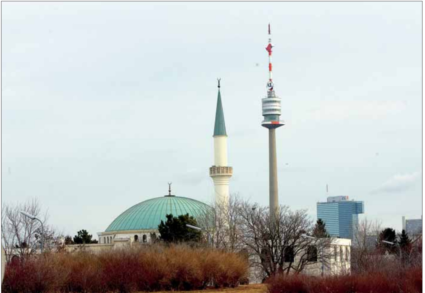
Moschee in Wien: Die islamische Glaubensgemeinschaft ist in Österreich seit 1912 anerkannt.