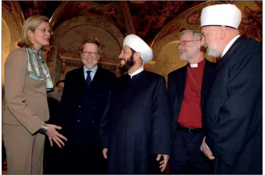
Treffen in Wien zum Thema Mohammed-Karikaturenstreit: Außenministerin Ursula Plassnik, Dänemarks Außenminister Per Stig Moeller, Geistliche.

Auch eine von der islamischen Glaubensgemeinschaft organisierte Konferenz im Dezember 2005 zu den frommen Stiftungen in Ost- und Südosteuropa ist ein Beleg dafür, dass von der islamischen Glaubensgemeinschaft in Österreich und vom österreichischen Islam wesentliche Impulse für den Islam