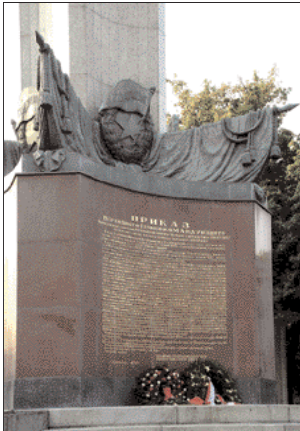
Russendenkmal am Schwarzenbergplatz: „Stalinbarock“ hinter dem Hochstrahlbrunnen.

Mitte 1949 unterstützte Innenminister Oskar Helmer ein Gnadengesuch der Mutter des K. K. mit dem Hinweis, dass das „Delikt einen Dummheitsakt darstellen dürfte, der mit der Sache Dürmayer zusammenhängt“. Helmer deutete damit an, dass sein Intimfeind, der damalige kommunistische Wiener Staatspolizeichef Heinrich Dürmayer mit der Art des Konfidenteneinsatzes übers Ziel hinausgeschossen habe. 1957