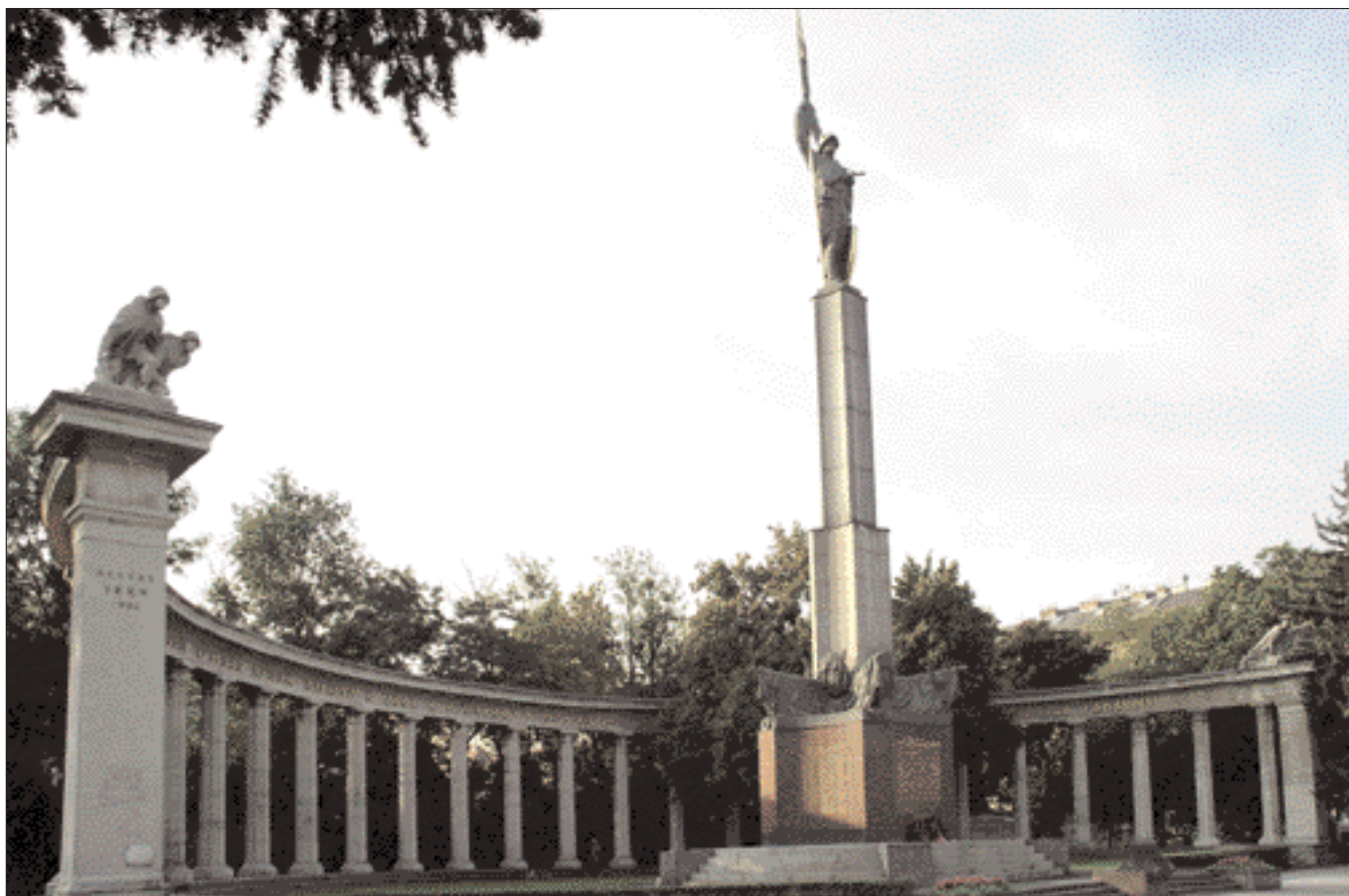
Das Russendenkmal besteht aus einem 20 Meter hohen Sockel mit einem zwölf Meter hohen Soldaten, dahinter befinden sich acht Meter hohe, abgerundete Balustraden mit 26 Säulen.

verfrorenheit erschienen sein. Auch der durch persönliche Gegenstände der Iлона Faber „markierte“ Fluchtweg deutete auf eine Entfernung des Täters hin, sodass man in andere Richtung ermittelte, etwa im „Halbstarkenmilieu“ und in Jazzklubs. Kino und Fernsehen wurden mit noch nicht da gewesener Intensität in die Tätersuche eingebunden.