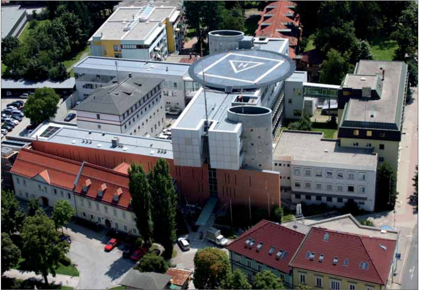
Sicherheitszentrum Klagenfurt: Sitz des Landespolizeikommandos Kärnten.