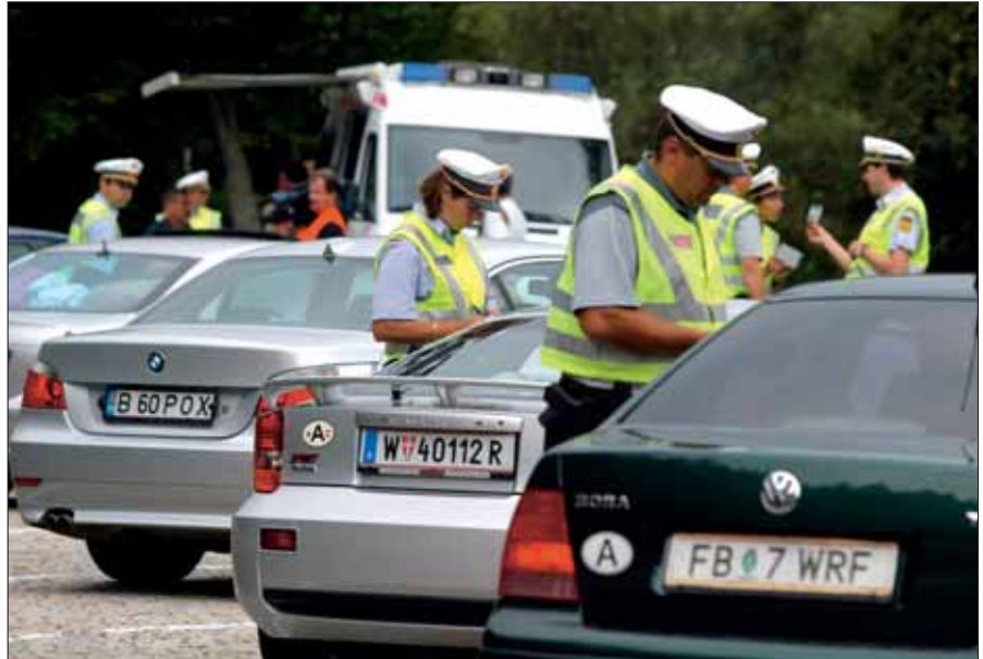
Umfassende Verkehrskontrolle: Schwerpunktaktion des LPK Kärnten.

Die Organisations- und Einsatzabteilung (OEA) ist zuständig für alle grundsätzlichen Angelegenheiten des