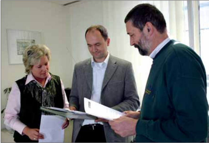
LPK Kärnten: Mitarbeiter der Personalabteilung.

zisten in den Stadtpolizeikommanden Klagenfurt und Villach mehr umstellen. Die Inspektionskommandanten sind jetzt nicht nur für eine Dienstgruppe verantwortlich, sondern für die gesamte Inspektion und deren Mitarbeiter sowie für den zugewiesenen Überwachungsbereich. Im Juli und August unterstützten dienstführende Beamte der BPKs im Rahmen von Dienstzuteilungen die Kollegen in den Stadtpolizeikommanden. „Dadurch ist es auch zu einem Erfahrungsaustausch zwischen den Kollegen in den Städten und auf dem Land gekommen“, berichtet Schrenk.