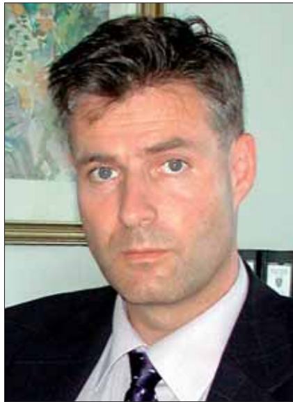
BVT-Direktor Gert Rene Polli: „Das Hauptaugenmerk der Arbeit des Amtes wird weiterhin die Verhinderung des politisch motivierten Extremismus sein.“

Rechtsextremismus. Der organisierte und nicht organisierte Rechtsextremismus stellt nach wie vor keine Gefahr für die Stabilität und Sicherheit des demokratischen Systems Österreichs dar. Wie in den vergangenen Jahren war der Rechtsextremismus in Österreich im Jahr 2004 von den Agitationen des