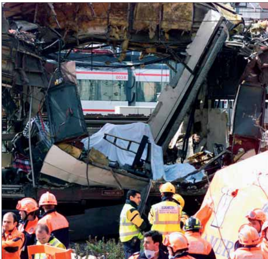
Terroranschlag am 11. März 2004 in Madrid: Notwendig ist eine gesamteuropäische Strategie bei der Terrorismusbekämpfung.

Proliferation. Präventivmaßnahmen zur Verhinderung von Proliferation wurden auf nationaler und internationa-