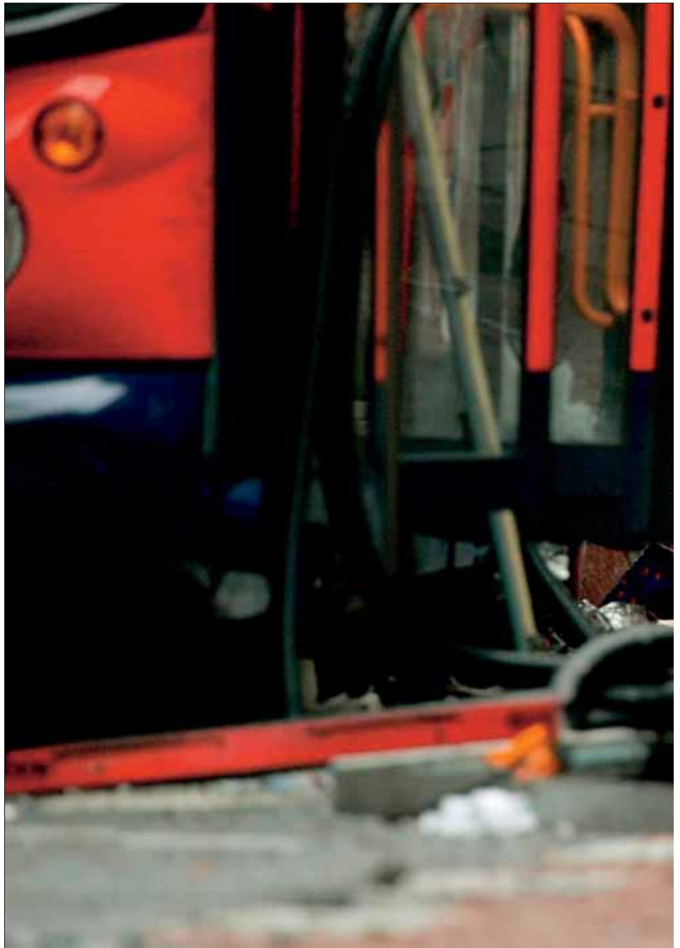
Terroranschlag in London: Europa ist nicht nur logistisches Zentrum für terroristische Vor

Terrorismus. Spätestens die folgenschweren Terroranschläge in Madrid am 11. März 2004 und in London im Juli 2005 waren der Beweis dafür, dass